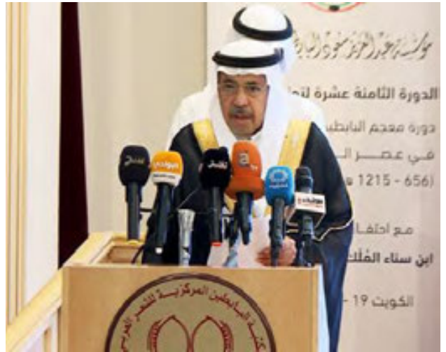
عبدالعزيز سعود البابطين

الدولة لشئون الشباب عبدالرحمن المطيري، وسط حضور دولي حاشد من الأدباء والمثقفين والسياسيين ومن أصحاب الفكر العرب.