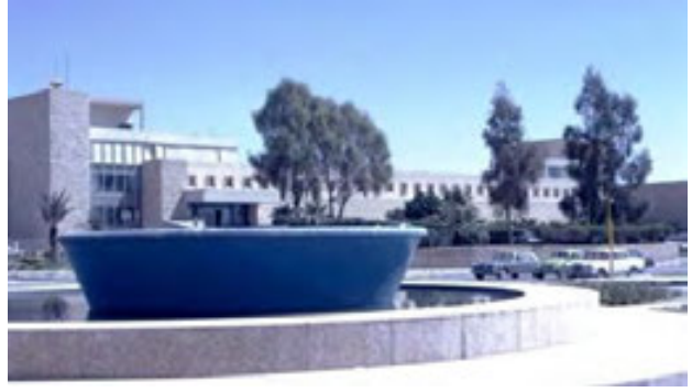
مبنى وزارة البترول القديم

الخبراء والأساتذة والمختصين في مشروع بناء الاستراتيجية الذي سيطرح قريباً.. "نعول على خبراتكم في هذا المجال.. أما إطلاق المبادرة فهو (إجراء إداري) لتحديد مسئولية الاختصاص وضمان عدم ازدواجية العمل، تهيئة ل طرح مشروع استراتيجية التُّراث الحديث خلال الشهرين القادمين.