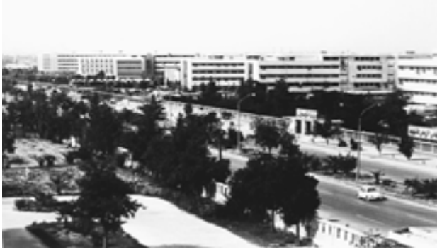
مباني الوزارات بطريق الملك عبدالعزيز