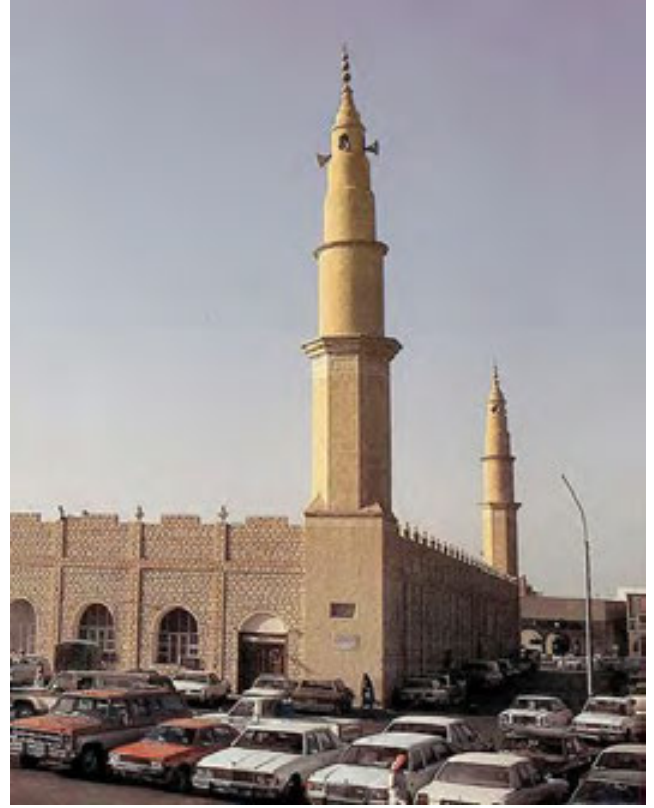
جامع الرياض الكبير

التراث من خلال سجل التراث العمراني المعني بتوثيق الذاكرة المكانية، وهيئة فنون التصميم والعمارة من خلال برنامج تطوير المحتوى العمراني، ووزارة المالية وصندوق الاستثمارات العامة فيما يتعلّق بتأهيل المباني واستغلالها واستثمارها.