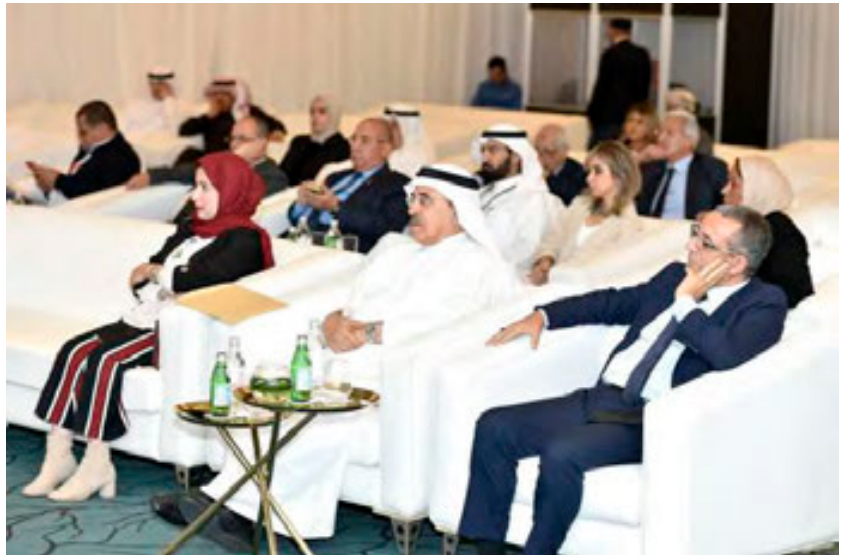
جانب من جمهور ندوة القرن

الريادة الثقافية (قوة مصر الناعمة)، دعم الصناعات الثقافية، تطوير الإدارة الثقافية، حماية وتعزيز التراث الثقافي، لافتة إلى مظاهر دعم التنوع الثقافي في مصر من خلال برنامجين أساسيين ارتكزت اليهما استراتيجية الثقافة المصرية، تمثل البرنامج الاستراتيجي الأول في دعم الصناعات الثقافية كمصدر قوة للاقتصاد المصري، وذلك من خلال تمكينها وزيادة الاستثمارات في قطاعها عبر طرح مشروعات جديدة من أجل خلق بيئة محفزة لرواد الأعمال والمبدعين المصريين، تمكنهم من تطوير منتجاتهم وعلاماتهم التجارية والمنافسة في الأسواق العالمية وهو ما نتج عنه تأسيس الشركة القابضة للاستثمار في الصناعات الثقافية والسينمائية، التي سيبدأ عملها بإنشاء شركتين، إحداها للسينما، والأخرى للحرف التقليدية، أما البرنامج الاستراتيجي الثاني لوزارة الثقافة، فيتمثل في حماية وتعزيز التراث غير المادي بكافة أشكاله وأنواعه، بهدف ضمان حماية وصيانة هذا التراث الحضاري ورفع الوعي الداخلي والخارجي به ومن أهم الإنجازات التي تمت في إطاره استعادة عدد من المخطوطات النادرة المملوكة لمصر قبل بيعها في مزادات علنية بالخارج، وجاءت الجلسة الثانية بعنوان ” السياسات والاستراتيجيات الثقافية..تمكين أم