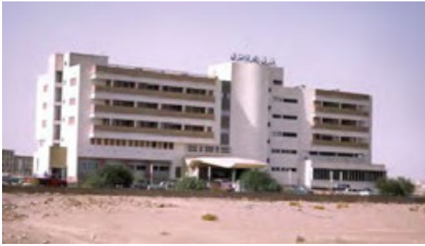
فندق زهرة الشرق- كيث ويلر