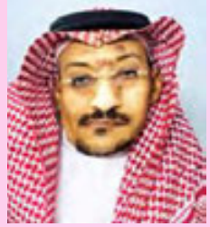
شعر : جبران محمد قحل المحامل