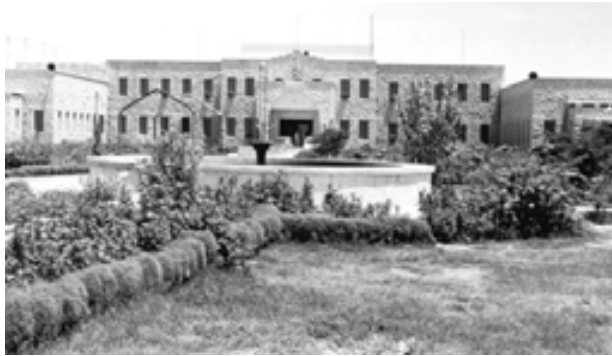
مبنى أمانة منطقة الرياض القديم

التراث من خلال سجل التراث العمراني المعني بتوثيق الذاكرة المكانية، وهيئة فنون التصميم والعمارة من خلال برنامج تطوير المحتوى العمراني، ووزارة المالية وصندوق الاستثمارات العامة فيما يتعلّق بتأهيل المباني واستغلالها واستثمارها.