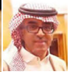
شعر : عبد الوهاب أبو زيد