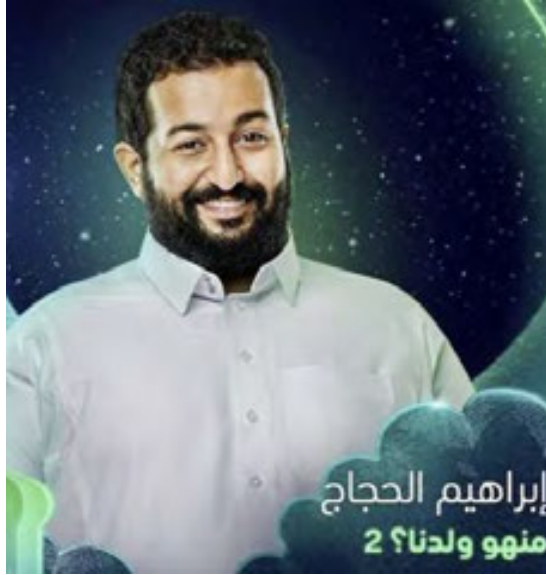
إبراهيم الحجاج منهو ولدنا؟ 2

الخليجية مثل الفنانة هدى حسين، وجمال الردهان، وفاطمة الصفي، وعبد الله البلوشي، ومنيرة محمد، ونوف سلطان، وسحر حسين، من إخراج علي العلي، وتأليف حمد الرومي، ويعرض عبر قنوات mbc، و MBC Drama، ومنصة شاهد الإلكترونية.