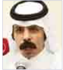
شعر : سعود كايد البلوي