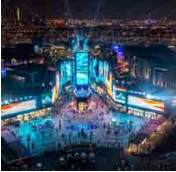
نمو هائل لقطاع السياحة الذي بات أحد أهم مصادر الدخل تحقيقاً لرؤية ٢٠٣٠