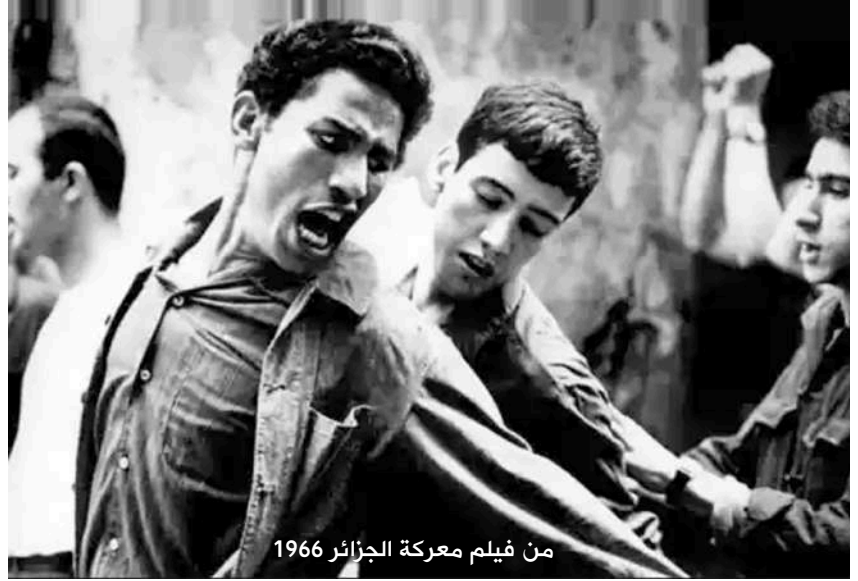
من فيلم معركة الجزائر 1966

- دعني أوضح لك التالي: نحن الآن شعب تحت الاحتلال. والمحتل سوف يبقى ماسكا بالذاكرة ويحبسها... «التذكر يصبح فعل تحرري» وهناك أكثر من خمسين مهرجاناً سينمائياً فلسطينياً حول العالم من بوسطن إلى شيكاغو إلى أمستردام إلى بريطانيا، إلى مالو في السويد، وإلى أستراليا، كل مهرجان يستقبل من مائتين إلى ثلاثمائة قسيمة اشتراك لأفلام فلسطينية أو عن فلسطين، ومنذ عشرين عاماً أو أكثر. هذه هي الثروة اليوم، شبكات التوزيع وإمكانيات الوصول إلى فئات عادية وبسيطة ومثقفة ومتفاوتة