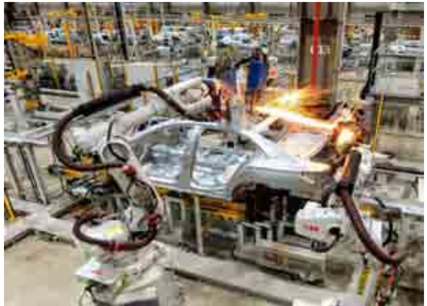
القطاع الصناعي حقق قفزات هائلة في دعم اقتصاد الوطن

وجاء اكتشاف عدد من حقول الغاز الطبيعي في بعض مناطق المملكة، ومنها (حقل شدون في المنطقة الوسطى، وحقلا شهاب والشرفة في الربع الخالي، وحقلا أم خنصر، وسمنة للغاز الطبيعي غير التقليدي في منطقتي الحدود الشمالية والشرقية)، ليضيف نعمة من نعم الله على هذه البلاد، ويعزز المخزون من الثروات والموارد، بما يدعم المكانة الرائدة للمملكة في قطاع الطاقة العالمي،