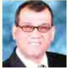
شعر منير فوزي