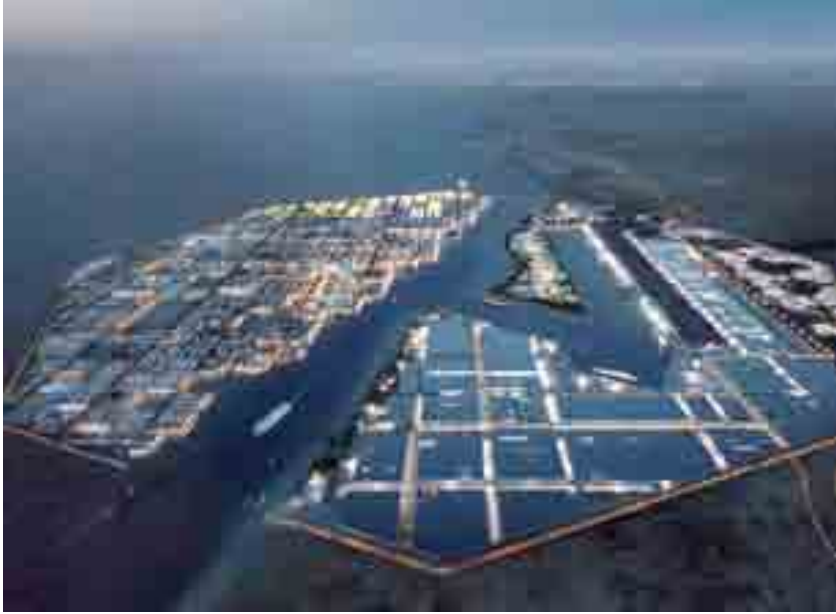
نيوم أحد المشاريع الرائدة لرؤية المملكة ٢٠٣٠

كافة، إضافة إلى قطاعات الإسكان والصحة والعمل، حيث تحرص القيادة الرشيدة أيدها الله على دعم الخطط والبرامج التي تسهم بإيجاد الحلول للتحديات أمامها، ومنها رفع نسبة التملك السكني للأسر السعودية إلى 70% بحلول 2030 بمشيئة الله، وحصول المواطنين والمواطنات على خدمة ورعاية صحية متميزتين، عبر منظومة متكاملة تعين على تحسين مستوى صحة وجودة حياة الأفراد والمجتمع، وكذلك زيادة مشاركة الكوادر الوطنية في سوق العمل السعودي وفتح مزيد من فرص العمل أمام أبناء وبنات وطننا العزيز. وقد حظيت المرأة السعودية باهتمام ورعاية لتؤدي دورها في التنمية والبناء والتطوير، من خلال تطوير قدراتها وبلورة دورها في المجالات الاجتماعية والاقتصادية وغيرها، وصولاً إلى تسنم مراكز قيادية ورفيعة في الجهات الحكومية والخاصة والمنظمات الدولية.