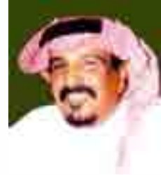
شعر سعد بن جدلان