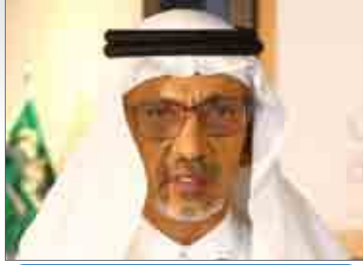
شعر : د. زاهر عثمان