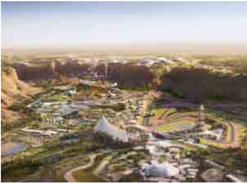
مشروع القدية أحد المشاريع الرائدة التي ستشكل علامة فارقة

والمحاسبة في الأعمال التجارية، وهذا يعكس ما توليه الدولة من اهتمام ودعم غير محدودين، وتوفير لكل الممكنات وإكساب تلك القطاعات وغيرها، دفعة قوية في طريق الريادة العالمية، ومواصلة تحقيق القفزات النوعية في التنافسية والمؤشرات الدولية.