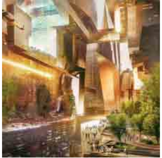
مشروع ذا لين بيهر العالم

على مجموعة واسعة من المشروعات في قطاعات مختلفة. ومع استمرار الاقتصاد السعودي بتحقيق معدلات نمو مرتفعة، وعلى الرغم من الارتفاعات الكبيرة لمستويات التضخم عالمياً؛ استطاعت المملكة - بفضل الله - ثم سياساتها النقدية والمالية والاقتصادية، الحد من آثار التضخم وتسجيل معدلات تعدد من الأقل عالمياً، فيما وصل معدل البطالة بالانخفاض في الربع الثاني، مقارنة مع الربع الأول 2022م ، ليصل إلى (9.7٪) ، حيث انخفض معدل البطالة للسعوديين الذكور إلى نسبة (4.7٪) مقارنةً بـ (5.1٪) ، وللسعوديات إلى نسبة (19.3٪) مقارنةً بـ (20.2٪) ، تماشياً مع خطط الوصول إلى المعدل المستهدف (7٪) في 2030 بمشيئة الله.