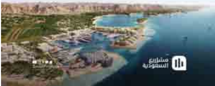
إنفوغرافيك عن مشروع أمالا الفريد

المنظمات والمجموعات الدولية على تعزيز التعاون الدولي لمواجهة التحديات في عالمنا، ودعم العمل الدولي متعدد الأطراف في إطار مبادئ الأمم المتحدة وصولاً إلى عالم أكثر سلمية وعدالة، وتحقيق مستقبل واعد للشعوب والأجيال القادمة. وفي ظل ما يشهده العالم من حروب وصراعات تؤكد المملكة ضرورة العودة لصوت العقل والحكمة وتفعيل قنوات الحوار والتفاوض والحلول السلمية بما يوقف القتال ويحمي المدنيين ويوفر فرص السلام والأمن والنماء للجميع.