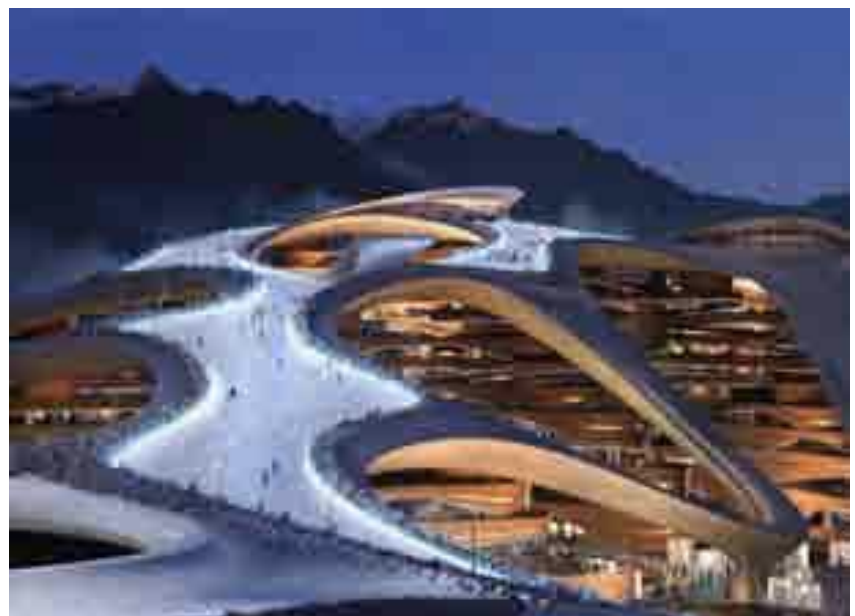
تروجينا حلم تحول إلى حقيقة