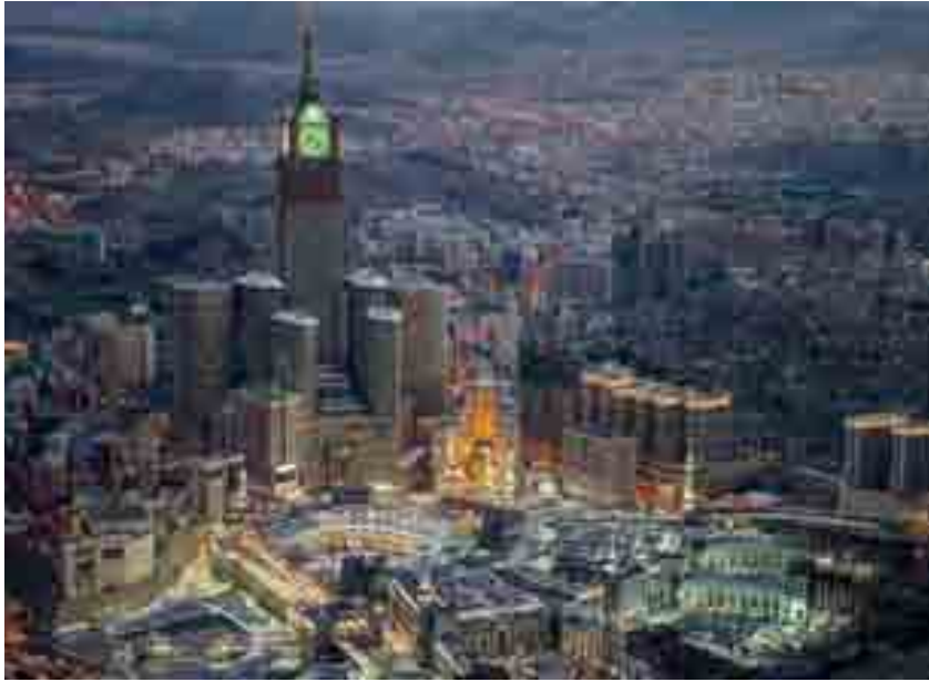
خدمة الحرمين الشريفين شرف كبير وجهود لا تتوقف

الكبير الذي حققته في مواجهة جائحة كورونا، وبذلت في سبيله جل إمكانياتها وطاقاتها؛ تجسيداً لدورها الريادي في العالم. وتماشياً مع خطط رفع الطاقة الاستيعابية لاستضافة 30 مليون معتمر بحلول عام 2030، تم إطلاق أعمال البنية التحتية والمخطط العام لمشروع «رؤى المدينة»، في المنطقة الواقعة شرق المسجد النبوي، والعمل جارٍ على استكمال التوسعة السعودية الثالثة في المسجد الحرام، إضافة إلى العديد من المشروعات التي تهدف إلى الارتقاء بمستوى الخدمات المقدمة لضيوف الرحمن، واستمرار توفير سبل الراحة والتيسير لقاطني الحرمين الشريفين وفق أعلى المعايير العالمية.