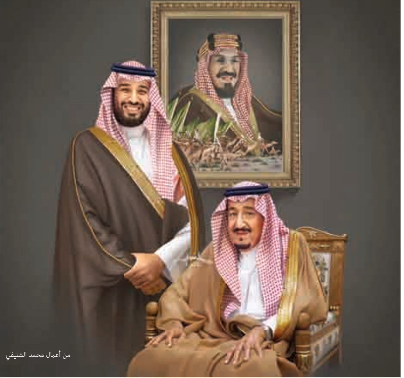
من أعمال محمد الشنيفي

الأزمات العالمية والخارجية والداخلية لم نُعقنا عن تحقيق طفرة حضارية في شتى الميادين؛ حيث حقق التعليم في مراحلها المتنوعة تقدماً وتطوراً هائلاً، وحصدت كثير من الجامعات السعودية مراكز عالمية متقدمة، وكذلك حقق الاقتصاد السعودي نمواً وتطوراً لافتاً، وقد تبوأَت المملكة ولا تزال مركزاً ريادياً وقيادياً مؤثراً في مجال إمدادات الطاقة العالمية من خلال عضويتها المهمة في منظمة أوبك وغيرها من المنظمات الدولية، وبالتوازي مع ذلك حققت المملكة زيادة وتنوعاً تصاعدياً للدخل القومي غير النفطي، وكل هذا وغيره من النجاحات نتيجة سياسة تنوع مصادر الدخل التي تبنتها قيادتنا الرشيدة».