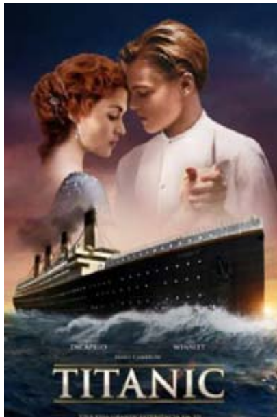
تيتانك آخر الإنتاجات العملاقة

الأمريكي «جارس ماكو» في أكاديمية «كود مان ثيتر» من بين الكتاب المتواجدين دوما في ستوديو الممثل كان الكاتب «آرثر ميلر» والكاتب «تنسي وليامز» ومن بين كبار المخرجين المخرج «إيليا كازان» وهو من أصل يوناني ومن مواليد الأناضول هاجرت عائلته إلى أمريكا وأكمل حياته الدراسية هناك. وقد أخرج «كازان» أهم مسرحيات «تنسي وليامز» قطة على صفيح ساخن، صيف ودخان، ليلة السحلية، هواية الحيوانات الزجاجية.. كانت أعمال تنسي وليامز تستهوي المخرج «إيليا كازان» وكان أن قدمها على المسرح فعمل على تحويلها إلى قصص