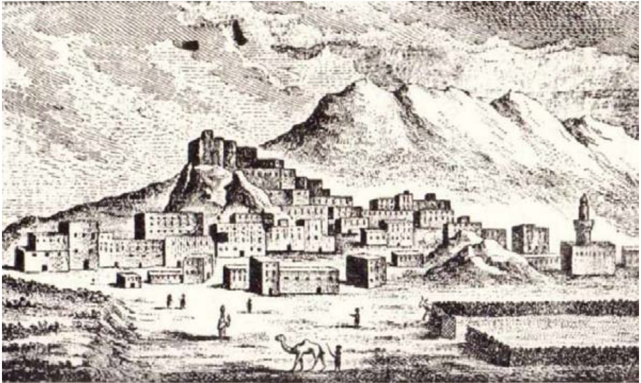
مدينة يريم بريشة نيبور كما شاهدها من نافذة الغرفة التي مات فيها فورسكال

في صباح اليوم الثاني من شهر تموز/يوليو 1763، كان فورسكال قد أصبح ضعيفاً أكثر من ذي قبل. وفي الرابع من الشهر نفسه، قرروا التوقف في خان على الطريق غير بعيد من مدينة يريم على أمل أن يستعيد فورسكال قواه بعض الشيء وبعد أن وعدهم مرافقوهم العرب بالاستعانة ببعض الرجال