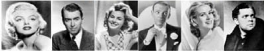
مارلين مونرو | جيمس ستوارت | إنغريد بيرغمان | فريد أستير | كريستين كيلي | أورسون ويلز

سينمائية، وكانت كل أعمال تنسي وليامز المسرحية تتدرج ضمن المسرحيات الاجتماعية ولكن بقراءة سيكولوجية تحليلية، فكانت الأعمال المسرحية حين تتحول إلى أفلام سينمائية فهي لا تتسم بالبساطة، إنما يضفي عليها فكر «تنسي وليامز» أبعاداً اجتماعية نابعة من عمق المجتمع الأمريكي. فأطلق على هذه الموجة من الأفلام «أفلام المجتمع الأمريكي» وأصبح لها جمهور واسع جدا من المشاهدين إضافة إلى تأثير نجوم هوليوود على المجتمع الأمريكي وجمهور وعشاق السينما. فأضاف «تنسي وليامز» للمسرحيات قصة سينمائية بصيغة روائية أقرب إلى السيناريو السينمائي، وهي رواية «ربيع مسز ستون الجميل»