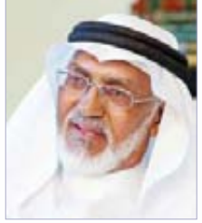
شعر : د. يوسف حسن العارف

(1) / الى اين أمضي ... والرياح تراب؟! وبيني وبين مدى الأنوار.. مهمه جائر وصعب . يقيني أن في الدنيا مدارات خوف/ زمهير/ وخراب. وأن على هذا التراب الخجول/أفئدة.. على لأوائها أتراب .