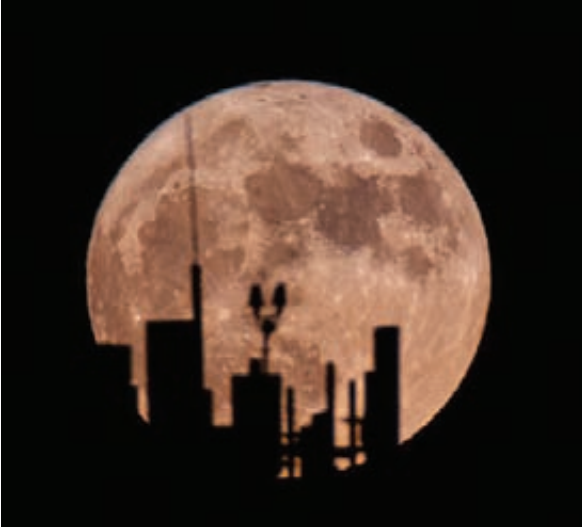
صورة للقمر العملاق - من شمال المملكة