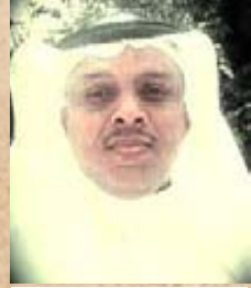
شعر : موسى الشافعي