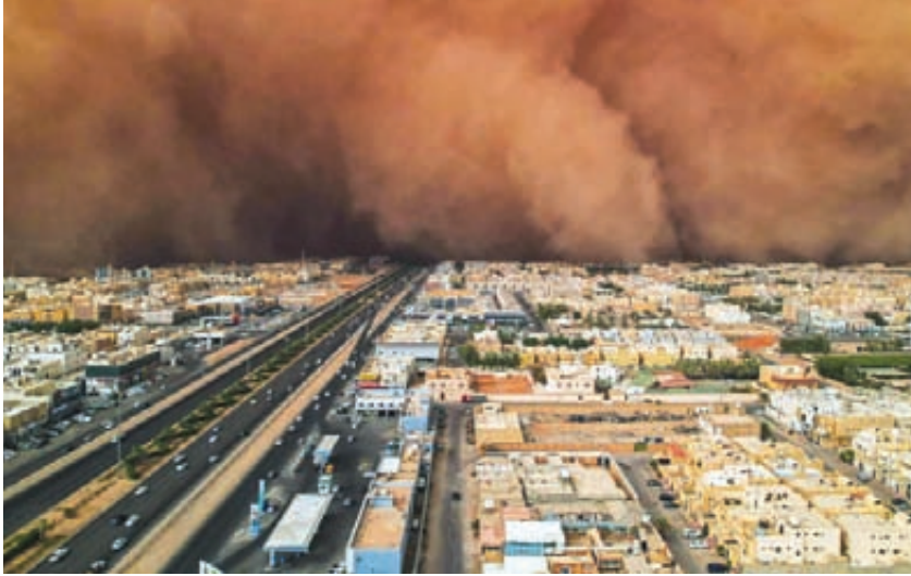
صورة لحظة اجتياح العاصفة الرملية مدينة الرياض

شرقها إلى غربها موجودة، لكن من المؤكد أن ثمة مكان ما له منزلة خاصة في قلبك وفي أعمالك الفنية.