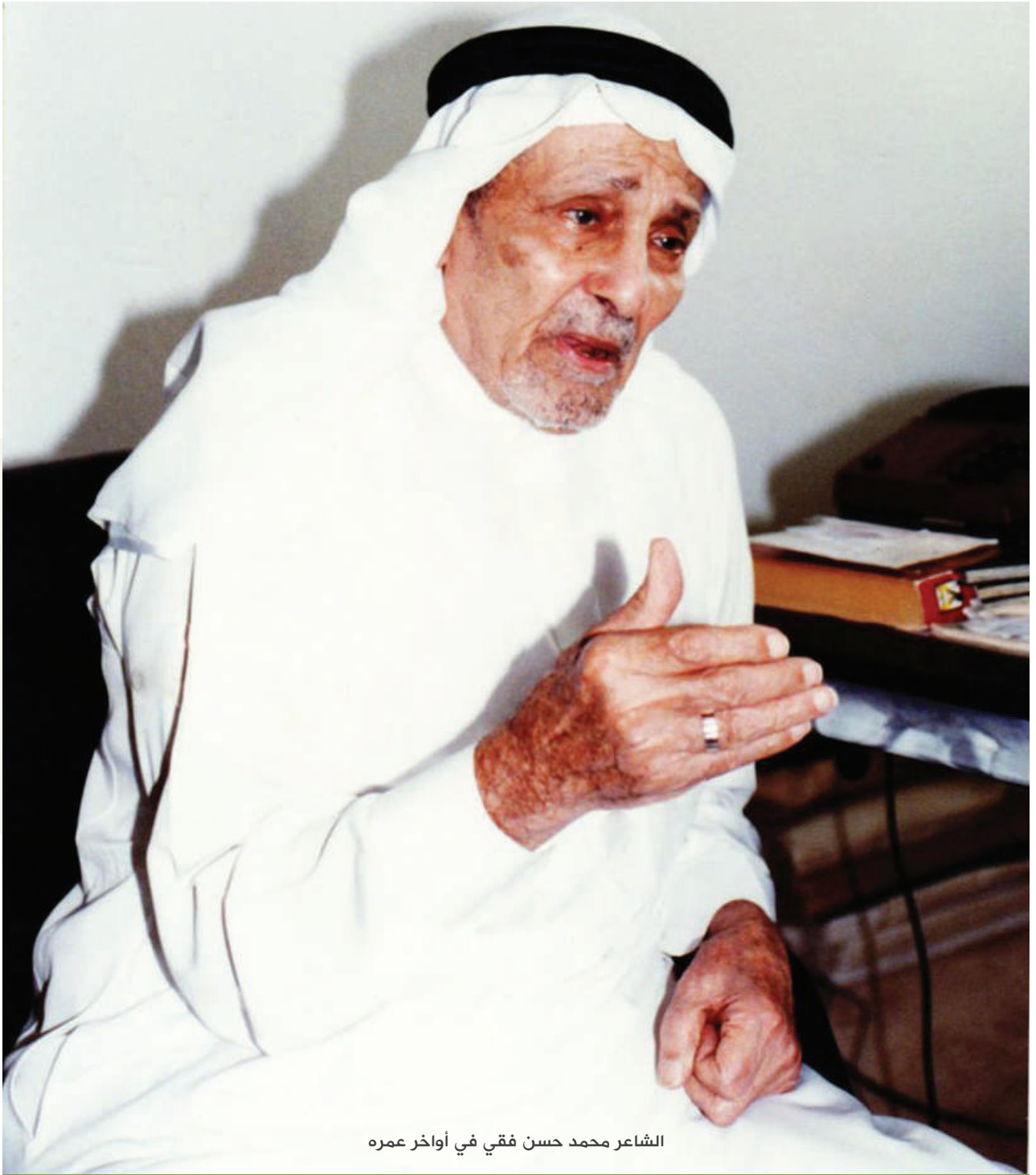
الشاعر محمد حسن فقي في أواخر عمره