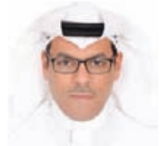
محمد بن سعد الملك