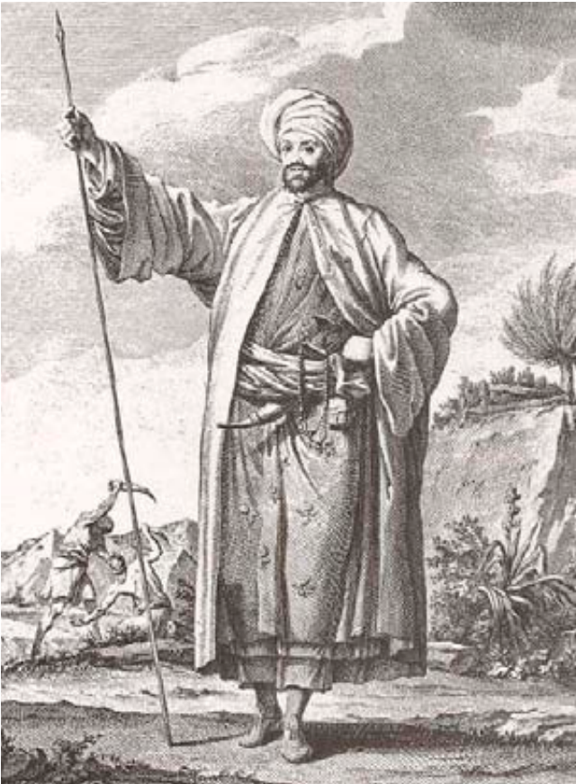
نيبور مرتديا الثياب التي أهده إياها إمام صنعاء المهدي العباس

واثنتان على جانبيه.. وكان الإمام جالساً على عرشه وقد لفت ساقيه تحته على الطريقة الشرقية في الجلوس... وعلى يساره ويمينه أخوته، وأمامه على المنصة المستطيلة يقف وزيره لشؤون الدولة الفقيه أحمد، وفي مكان منخفض عن المنصة المستطيلة أخذ أعضاء البعثة أماكنهم، وعلى امتداد الجدران يقف صفان طويلان من الزعماء العرب».