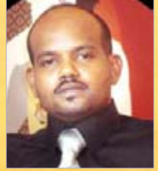
شعر: د. ناشد أحمد عوض