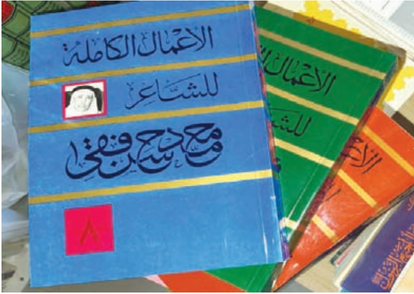
مجلدات الأعمال الكاملة لمحمد حسن فقي

توفيت والدته وهو لم يتجاوز السبعة أشهر وفي السادسة عشر من عمره توفي والده لينشأ يتيم الأبوين ويبدأ بذلك مرحلة جديدة من حياته تجمع بين طلب العلم وطلب الرزق بعد أن أصبح مسؤولاً عن عائلة مكونة من أخواته البنات».