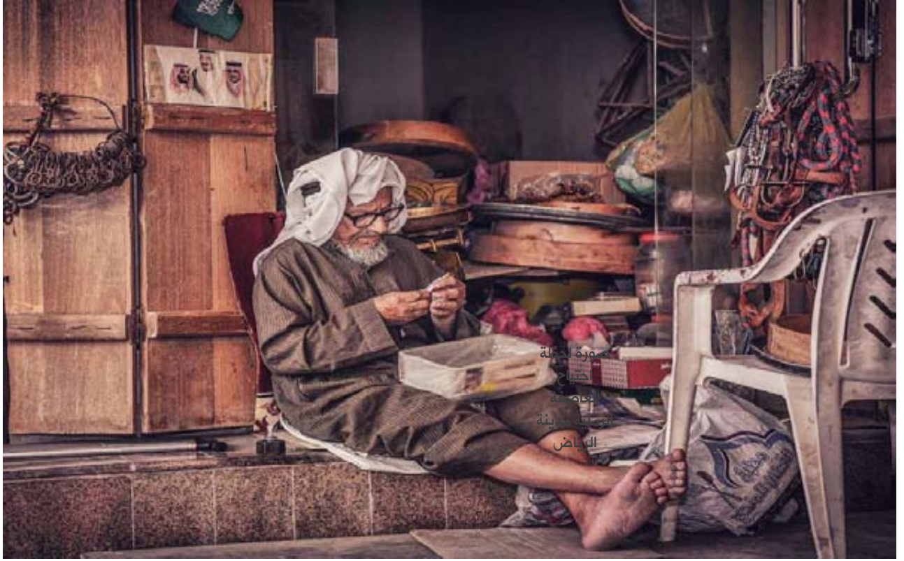
صورة وقصة .. صور متنوعة لأهل المملكة

كان مشهداً عظيماً يستحق الانتظار والتوثيق، هذه الصورة تعتبر من أصعب الصور التي قمت بالتقاطها لأنها لحظة قد لا تتكرر مرة أخرى في العمر. *المكان حاضراً بقوة في معظم صورك، نجده أكثر دفئاً وإشعاعاً وحميمية، يمكننا رؤية معظم مناطق المملكة من