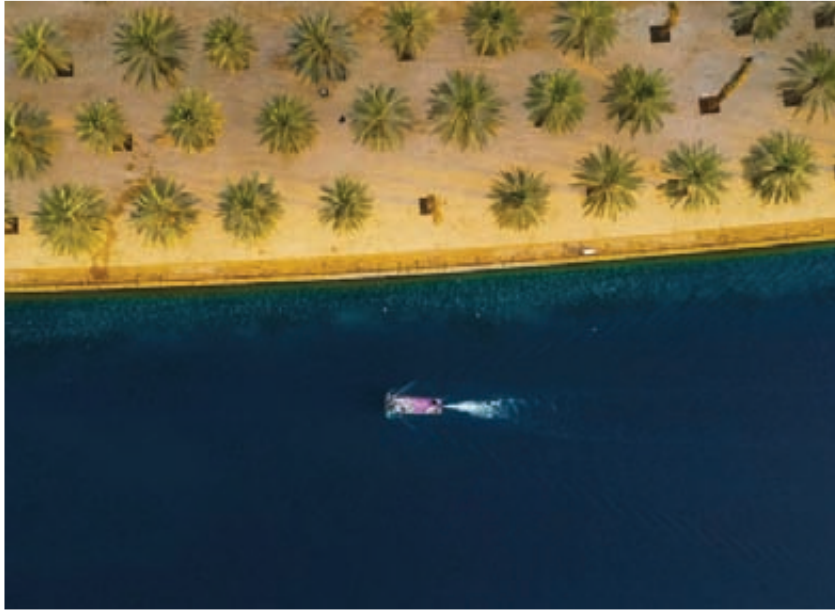
صورة لبحيرة وادي نمار ، ما بين النخيل والماء

فكثيرون يشترتون كاميرا ويبدوون في التصوير، ثم بعد فترة يتوقفون إما بسبب الكسل أو بعد مواجهة أول نقد لأعمالهم أو لغيرها من الأسباب، لذا يجب المثابرة والتحلي برحابة الصدر عند مواجهة النقد، مع ضرورة مشاهدة الكثير من الصور ومتابعة أعمال الآخرين، لا سيما أعمال كبار المصورين المحترفين، لأن هذا يكسب المصور خبرة تُضاف إليه. وفي ظل رؤية المملكة 2030 وقيام سيدي ولي العهد، الأمير محمد بن سلمان، بوضع الشباب ضمن أبرز اهتماماته، فإن الفرص الآن باتت متاحة لمعظم الشباب أن يبدعوا وأن يجدوا من يحتضن ابداعاتهم، في ظل اتساع فرص التفوق المهية لهم في جميع المجالات والاهتمامات.