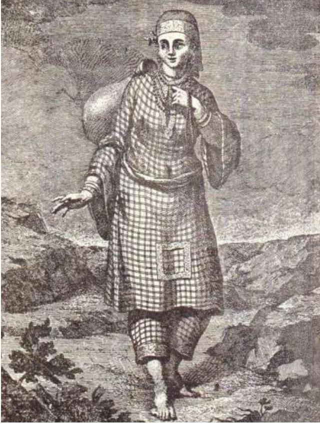
فتاة يمنية جبلية بريشة بورنفايند