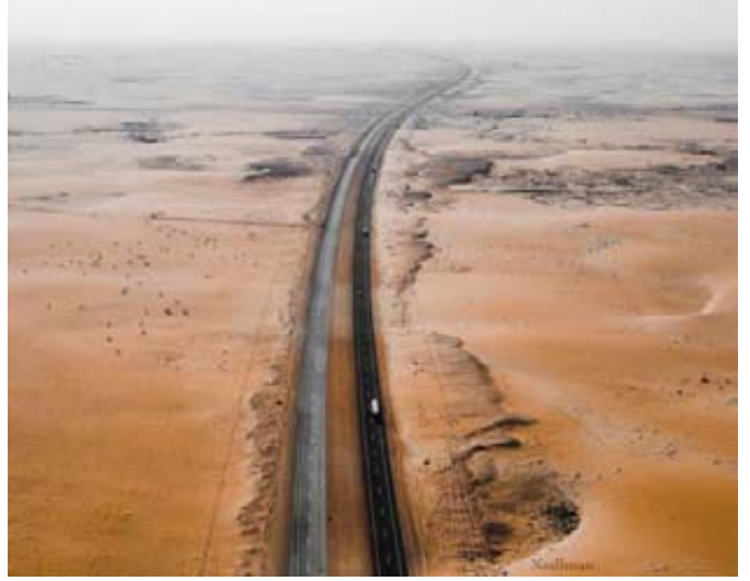
طرق وطرق المملكة حاضرة أيضا في صورته الرائعة