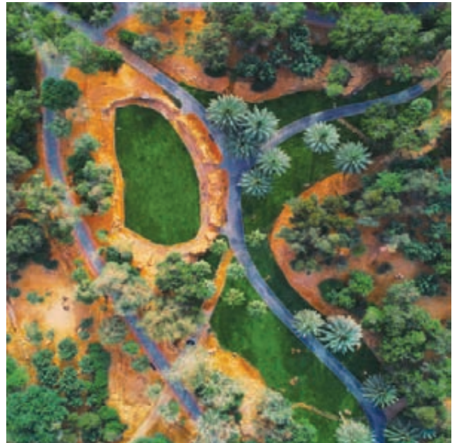
جانب من تصويره للرياض