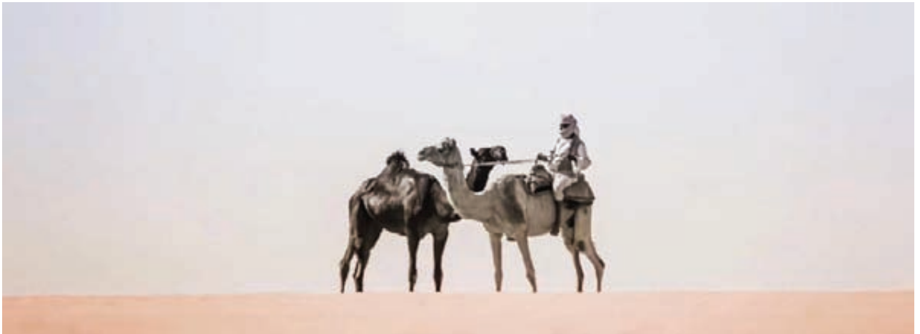
جانب من تصويره للإبل في المملكة .. حيث يعشق تصويرها

نحتفظ به للأبد في صورة، أريد لمن يرى الصورة أن يستشعر شيئاً جديداً لم يلحظه من قبل، حتى وإن كانت الصورة لشيء اعتاد رؤيته كثيراً، أريد من الصورة