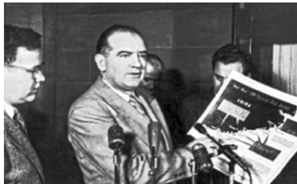
جوزيف مكارثي حملة ضد اليسار الثقافي

رغم شهرة النجوم ورغم جمال الأفلام المتقنة الصنعة، ورغم أسرار الإنتاجات السينمائية وطبيعتها، إلا أن الحريين العالميتين ألفت بظلالها على الواقع الإنساني وهزت كيان المجتمعات من الجذور وحطمت سياسات هوليوود وشركاتها على صعد شتى حتى أنها أنهت حقبة من إنتاجات أفلام المجتمع الأمريكي، وأيضا النتاجات ذات النهج الاستعراضى والغنائى. وساد العالم رعب مخيف ذو بعد اقتصادي هز كيان كل طبقات المجتمع.