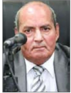
عرض: د. محمد صالح الشنطي