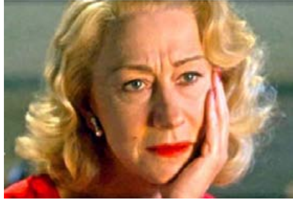
فيفيان لي «ربيع مسز ستون»

كليي عندما عرض عليها أمير موناكو «رينيه الثالث» الزواج فضلت أن تتوج أميرة على أن تبقى ممثلة شهيرة، وقد اشترى لها زوجها كل أفلامها ليتمتعوا بمشاهدتها فقط في موناكو. الممثلة «جوان كراوفورد» اقترنت بصاحب شركة البيبسي كولا «الفريد