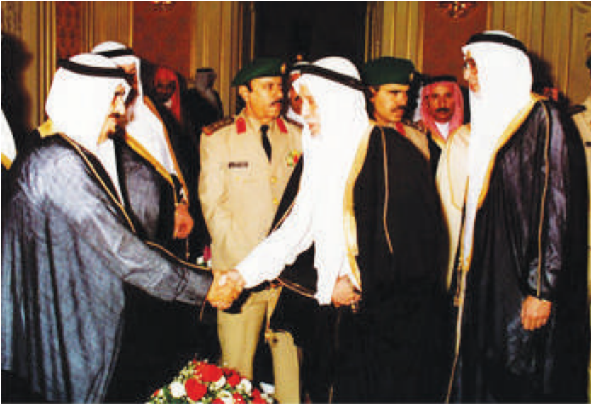
يصافح الملك فهد في إحدى المناسبات - رحمهما الله

وبعد إكمال دراسته أصرت شقيقاته على زواجه مبكراً فكان ذلك، أما مصادر معارفه فهي العديد من الكتب الأدبية القديمة والحديثة والدواوين الشعرية، فكانت مكتبته تحتوي على مجموعة كبيرة من كتب الدكتور طه حسين والعقاد والمازني وأحمد أمين ومصطفى صادق الرافعي وميخائيل نعيمة وجبران خليل جبران وإيليا أبو ماضي ونسيب عريضة والزهاوي والرفاعي والجواهري والأخطل الصغير وبدوي الجبل وغيرهم، بالإضافة إلى أمهات المعاجم اللغوية وكتب التاريخ والفلسفة وما إليها من شتى المعارف والعلوم والفنون، وكل ذلك أسهم في تكوين ذائقته الشعرية والأدبية ومعرفته الواسعة.