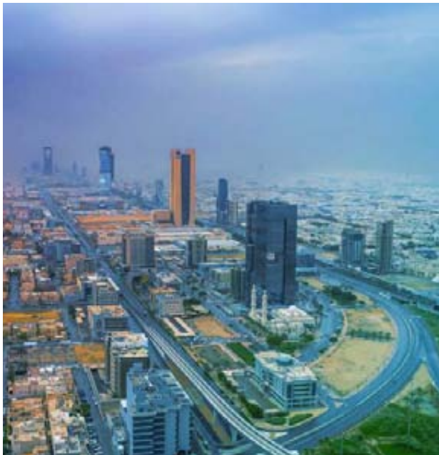
الضباب والمطر في الرياض

** خلال شهر مايو من العام الماضي، حذر الدفاع المدني بتغريدة عبر حسابه على تويتر من حدوث عواصف رملية في منطقة الرياض، وأشار إلى أنها قد تؤدي إلى انعدام الرؤية ونشاط في الرياح التي ستكون مصحوبة بالرمال والغبار الكثيف، فقررت أن أقوم بتجهيز