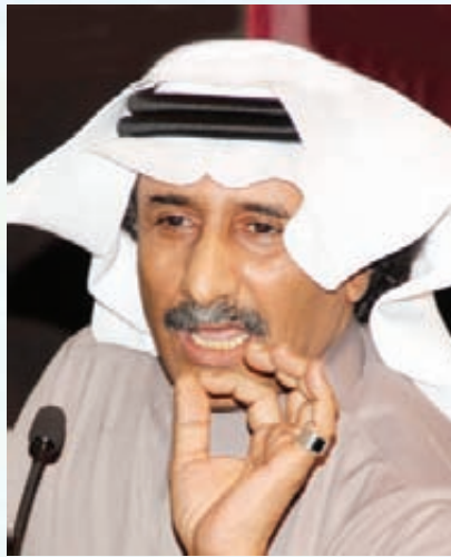
شعر : أحمد السيد عطيف