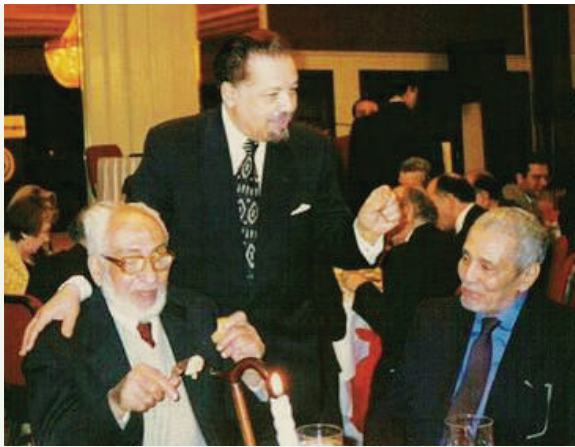
الشاعر الراحل مع أحمد زكي يمانى ومحمود محمد شاكر

- عين سفيراً في إندونيسيا وعمل في وزارة المالية ورأس تحرير صوت الحجاز