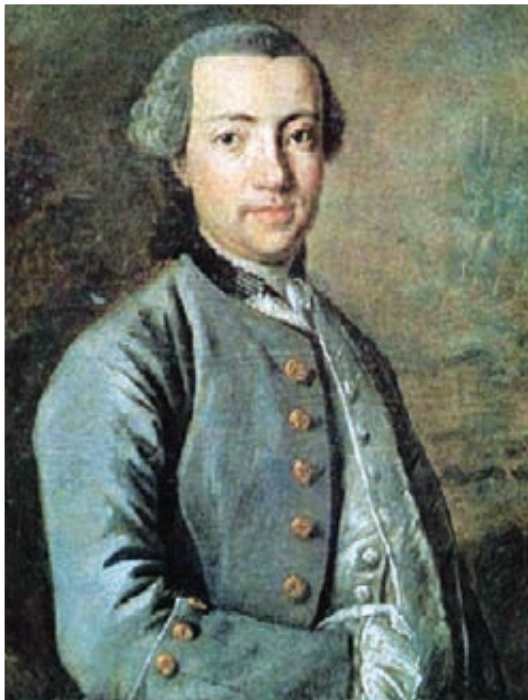
بيتر فورسكال يموت في أرض غربية واللصوص ينبشون قبره في يريم

تستمر أحداث أول بعثة علمية أوروبية إلى شبه الجزيرة العربية هدفت إلى اكتشاف المنطقة الشمالية الغربية من الجزء الجنوبي من الجزيرة. وكانت هذه البعثة الدنماركية قد تكونت من خمسة علماء أوروبيين شهيرين بعثهم ملك الدنمارك، فردريك الخامس، قبل ٢٦٠ عاماً، وتحديداً في العام ١٧٦١م إلى ما يعرف في أوروبا حينها باسم «العربية السعودية» مروراً ببلدان وأقاليم أخرى.