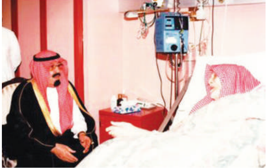
الملك عبدالله بن عبدالعزيز (ولي العهد حينها) يزور فقي في المستشفى

لا يجلس على كرسي مكتبه أمام ضيف أكد الأستاذ علي فقتدش التواضع الكبير الذي كان يتمتع به الشاعر محمد حسن