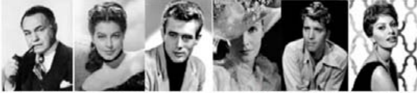
أورسون ويلز | إنغريد بيرغمان | جيمس دين | بريت لانسكتر | كريستا كاربو | صوفيا لورين