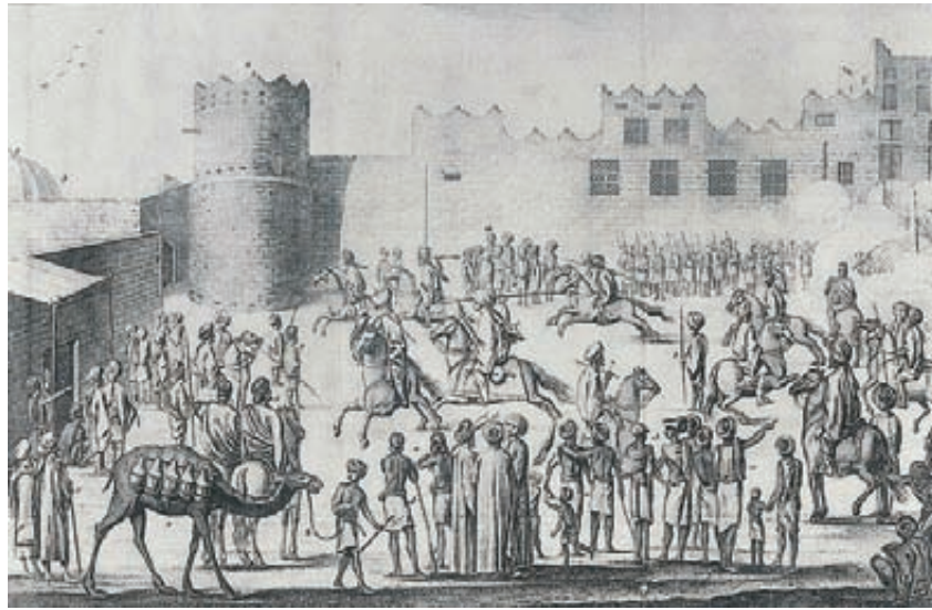
تدريبات حربية لجنود الإمام المهدي العباس كما رسمها نيبور سنة 1762م

بعد يومين من الوصول إلى صنعاء، استقبل ملك مملكة اليمن الإمام الملقب باسم المهدي العباس، أعضاء البعثة في مقابلة رسمية عامة بعد أن أخذهم قبل الظهر كاتب الفقيه أحمد إلى القصر وقد اتخذت بعض الترتيبات لاستقبالهم، وازدحم الميدان العام بالخيل والخدم والموظفين، وذلك في التاسع عشر من تموز/يوليو 1763.