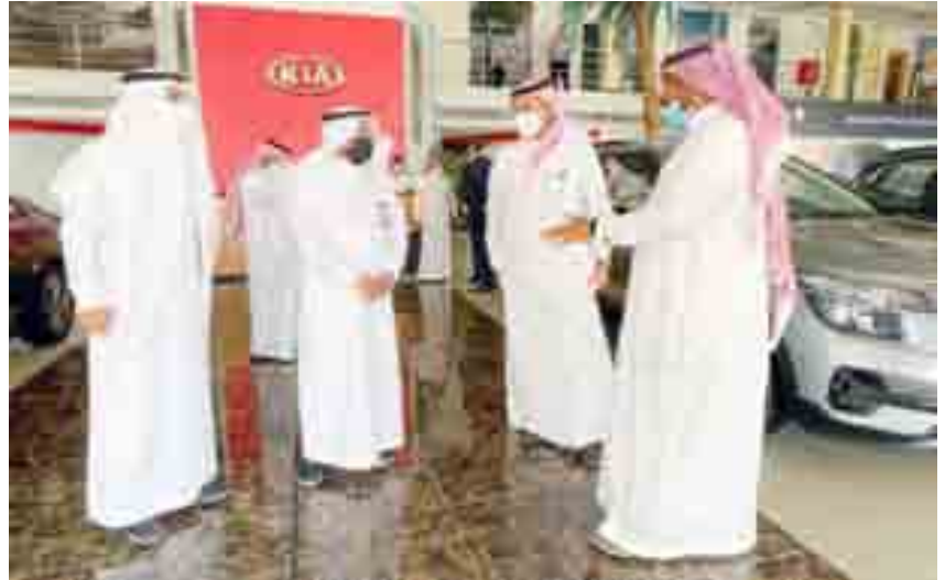
مبادرة مشروع (تاكسي) مع شركة الجبر لتوفير 14 سيارة للأيتام والأرامل

بحضور صاحب سمو الملكي الأمير تركي بن محمد بن فهد وزير الدولة عضو مجلس الوزراء رئيس مجلس إدارة جمعية بناء لرعاية الأيتام بالمنطقة الشرقية، ومعالي وزير الشؤون البلدية والقروية والإسكان الأستاذ ماجد الحقييل، وقّعت وزارة الشؤون البلدية والقروية والإسكان اتفاقية مع