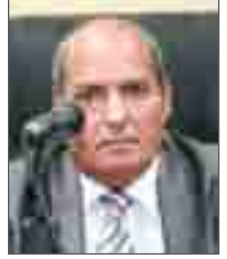
عرض: د. محمد صالح الشنطي

للأديب الكبير علي الدميني (عليه رحمة الله) حضور إبداعي ونقدي وفكري وإعلامي يمتد على مساحة زمنية شاسعة منذ عقد السبعينيات، وليس من الممكن قراءة مسيرته الإبداعية في الشعر في مثل هذه المقالة التأبينية، بل تقتضي دراسة موروثه الإبداعي جهداً بحثياً كبيراً متعدد الأبعاد، وقد رأيت أن أطلّ على شعره في عجالة وفاء لذكراه وتبويهاً بما قدّمه من إسهام وافر في الحركة الشعرية الحديثة في المملكة العربية السعودية، فقد كانت دواوينه العديدة ابتداءً من (رياح المواقع) الذي صدر عام 1987م ومروراً بـ (بياض الأزمنة) عام 1999م و (مثلما نفتح الأبواب) و (بأجنحتها تدقّ أجراس النافذة) عام 1999م و (خرز الوقت 2016) وليس انتهاءً بـ (إشراقات رعوية لجسد الماء 2018) إنجازاً لقيمة مضافة للشعر العربي الحديث في المملكة العربية السعودية.