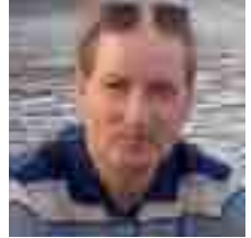
اختيار وإعداد: باسم العربي