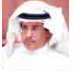
شعر : خالد الطويل