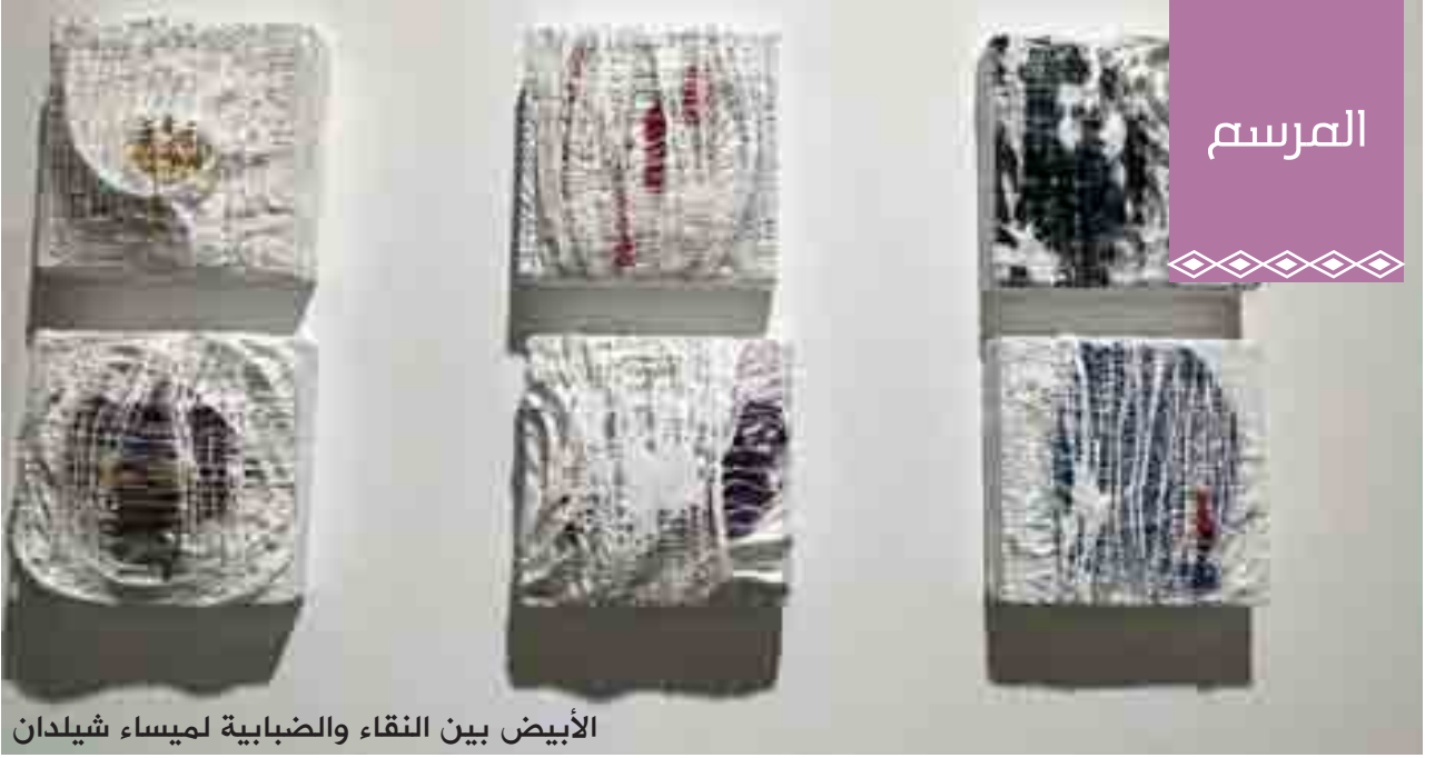
الأبيض بين النقاء والضبابية لميساء شيلدان