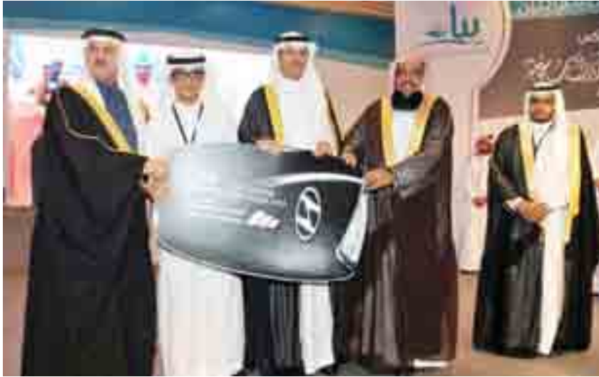
لقطة من حفل بناء لتكريم المتفوقين

أن هذا المخيم يمثل إضافة ثمرة ستكون خير معين للطلاب في دراستهم الجامعية في المستقبل القريب بإذن الله، وأضاف: "حصل الطلاب على مجموعة من المعارف والمهارات الإثرائية ذات الارتباط الوثيق برؤية المملكة 2030، وتساهم في بناء الثقة وتطوير الذات، وتطلع أن تساندهم هذه المعارف ليساهموا بشكل فاعل في تحقيق مستهدفات الرؤية الطموحة ويكونوا جزءاً فاعلاً ومؤثراً في خدمة الوطن".