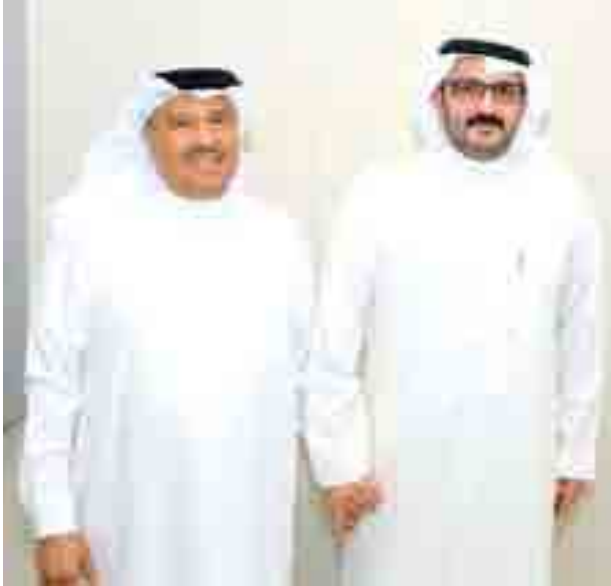
الكاتب مع الفنان محمد عبده