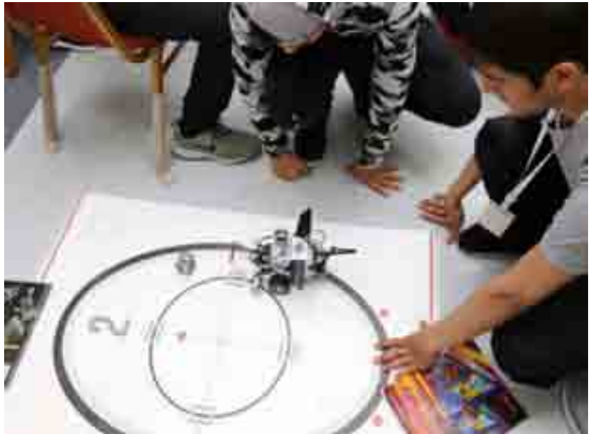
من مشاريع الطلاب في المخيم العلمي الخامس (مسبار 5)

- مشاريع نوعية ومبادرات وشراكات مع أغلب قطاعات المجتمع