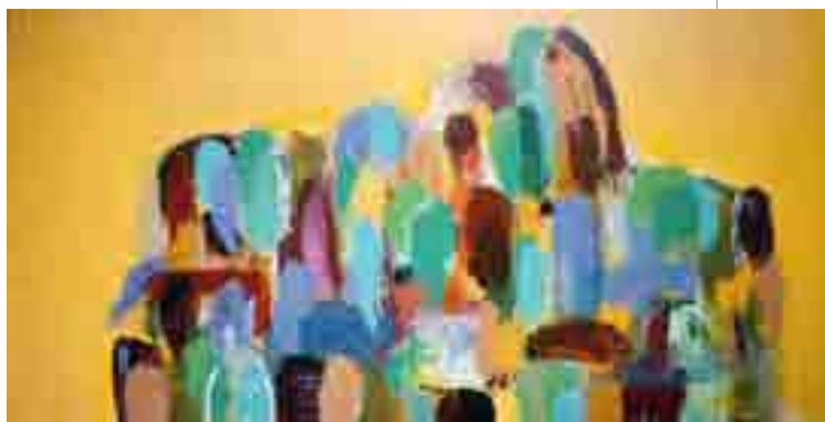
الولادة والتجدد في رسوم عالية مارديني