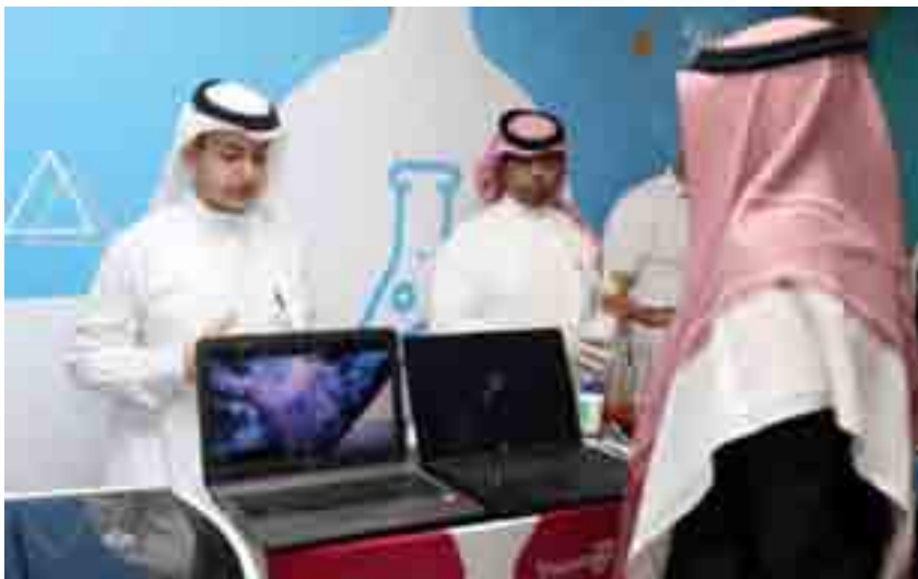
من مشاريع الطلاب في المخيم العلمي الخامس (مسبار 5)

تضمن حفل اختتام المخيم فيلماً عن إنجازاته وآراء الطلاب المشاركين، كما تم استعراض مشاريع الطلاب التي اشتملت على تطبيق عملي لما تعلموه في فترة المخيم في عدد من المجالات، حيث اشتمل بعضها على مجالات طبية مثل الكشف عن مرض (باركنسون) ومسار الذكاء الاصطناعي من خلال التواصل مع أصحاب الهمم باستخدام الذكاء الاصطناعي ومسار الطاقة المتجددة.