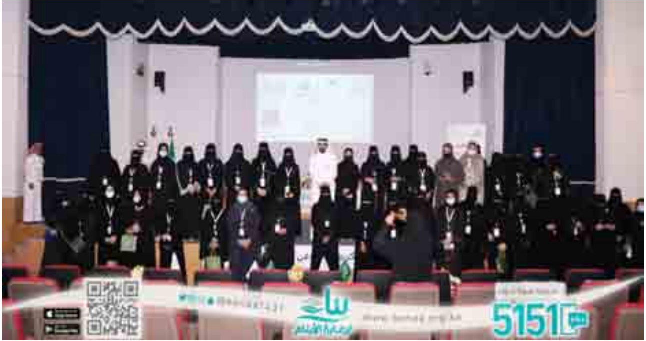
صورة جماعية لحفل تكريم المتطوعين والمتطوعات من أبناء الجمعية ساهموا في أعمال تطوعية متنوعة