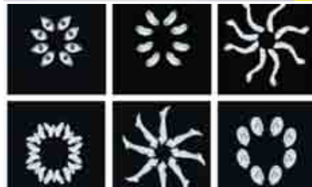
جوارح لفهد النصار

يعتبر المصور الفوتوغرافي فهد نصار أن جوارح الإنسان هي نقطة التقائه وتواصله مع الآخرين هي المدخل والمخرج