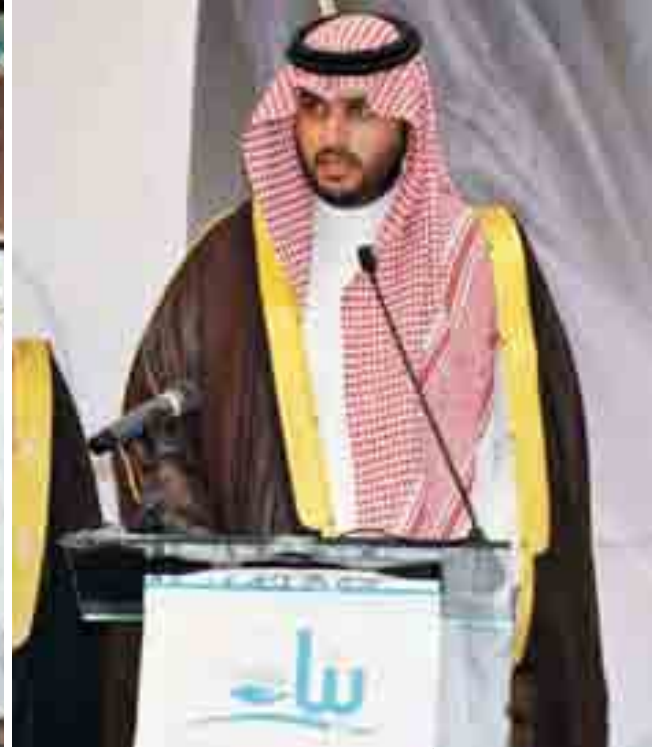
صاحب السمو الملكي الأمير تركي بن محمد بن فهد بن عبدالعزيز، وزير الدولة عضو مجلس الوزراء رئيس مجلس إدارة جمعية بناء

خبرات العاملين في جمعيات رعاية الأيتام، ومبادرة أرامكو لتطوير الأيتام، ومبادرة أهالينا، ومبادرة بناء القدرات وتبادل الخبرات، ومبادرة كنف للتأمين الطبي.