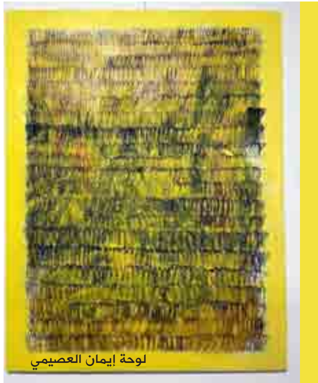
لوحة إيمان العصيمي

عمدت على إظهار التوازن القائم على النموذج في لوحاتها، بحيث تصور أعمالها من مفهومها الذاتي الخاص. وترفق العمل بوصف: سيغموند فرويد في نظريته يقول بأن أغلب المشكلات النفسية يكون أساسها هو تعارض واضطراب بين رغبات أساسية ثلاث في النفس البشرية... والتي عيرت عنها الفنانة في لوحاتها، فالقط يعبر عن الغرائز الخالصة والمجردة بداخلنا تلك التي لا نعلم حتى بوجودها مثل رغبتنا بقتل أحدهم لأنه تسبب بظلمنا أو سرقتنا وهنا يأتي دور مالك القط لكي يمنع ويقنن تلك الغرائز..