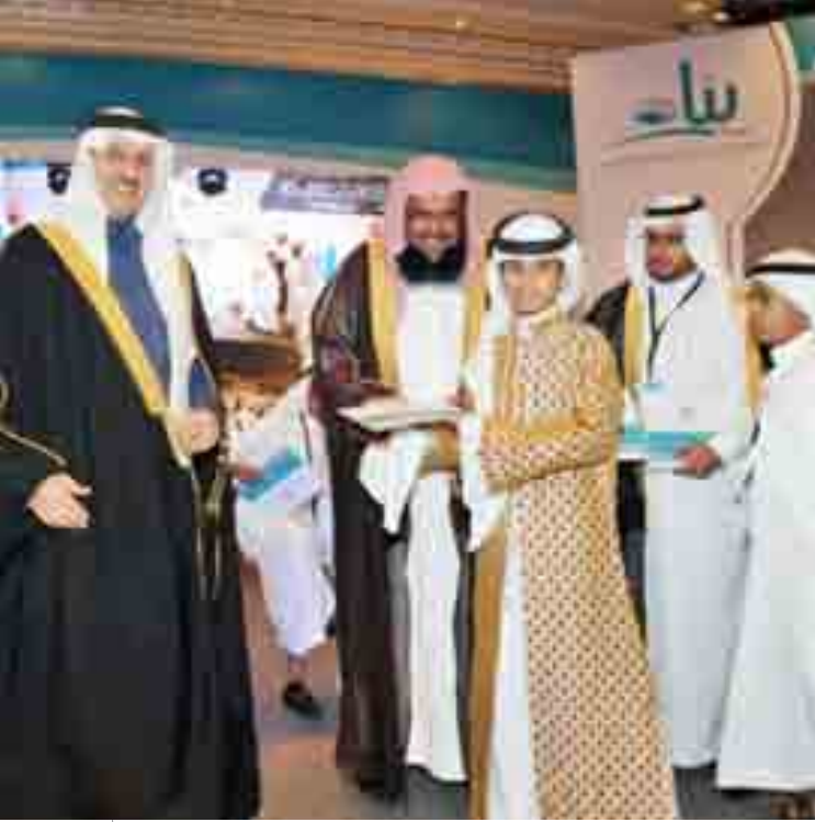
من حفل بناء لتكريم المتفوقين