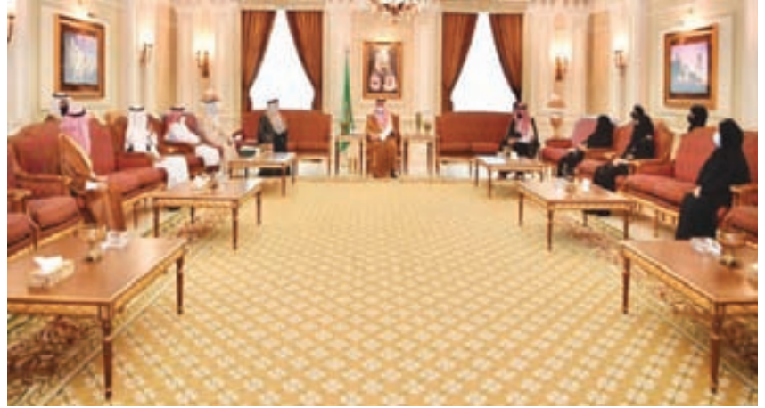
الأمير مشعل بن ماجد يلتقي ويكرم رؤساء مراكز الأحياء المتميزة بمحافظة جدة

بمحافظة جدة، وذلك تقديرًا لدورها الريادي ضمن مساهماتها المجتمعية لتنمية قطاع التطوع لتكون من ضمن أعلى خمس جمعيات مساهمة في تحقيق رؤية المملكة 2030 بمعيار التطوع لعام 2020، وجاء التكريم خلال حفل يوم التطوع السعودي والعالمي، والذي أقيم تحت شعار "عطاء وطن"، وأعرب معالي الوزير عن فخره بأن