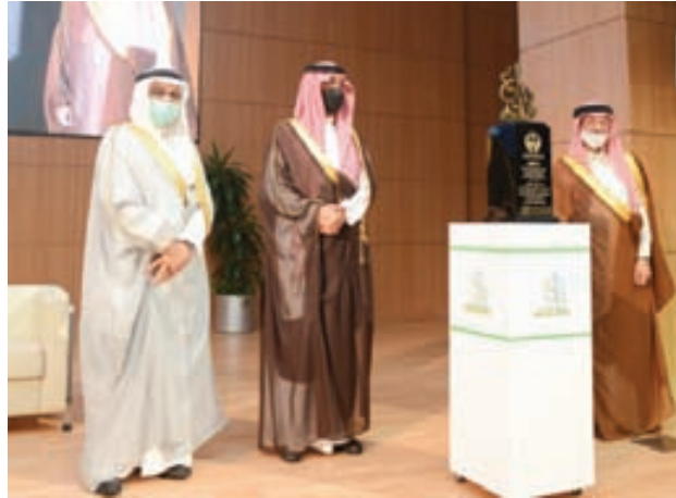
تكريم جمعية مراكز الأحياء بمحافظة جدة لحصولها على جائزة جدة للإبداع

1 - غرس وتعزيز قيم رئيسة في المجتمع، تساهم في تقليل الظواهر السلبية في المجتمع، وتساعد على تحقيق أحياء تُستثمر فيها طاقات الحي في الحفاظ على مكتسبات الحي وبنيته الاجتماعية. 2 - تطوير وتنمية فن التفاوض والتشاور بين أفراد الحي للوصول إلى قرارات مفيدة تخدم الحي.