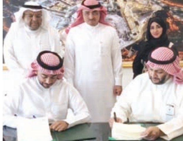
اتفاقية تعاون وشراكة بين الجمعية وعبادات الأعمال لتمكين ألف أسرة منتجة خلال 2019 اقتصادياً واجتماعياً وتموياً

3 - نشر ثقافة العمل الاجتماعي المؤسسي كقيمة هامة بمجتمع الحي لضمان نجاح البرامج والخدمات، وتكوين فرق عمل تقوم بدورها في تنفيذ برامج الجمعية من خلال العمل الجماعي المشترك.