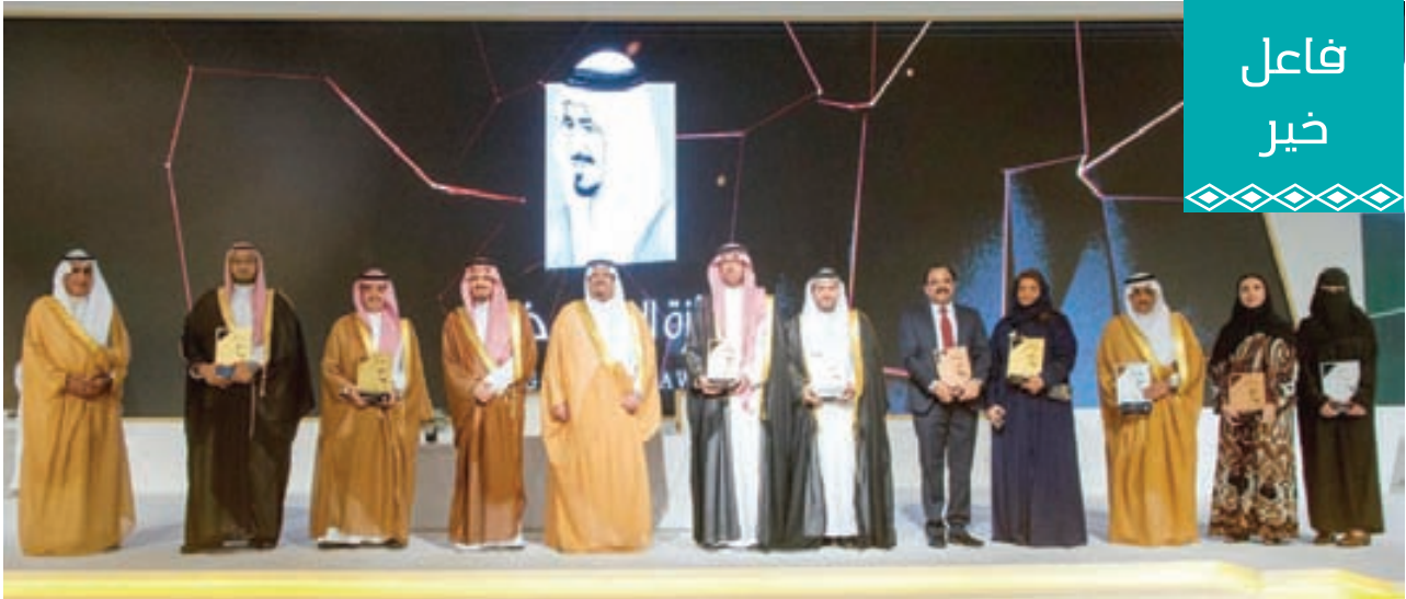
من حفل جائزة الملك خالد لتمييز المنظمات غير الربحية

نالَت العديد من الجوائز لتمييز خدماتها وبرامجها: