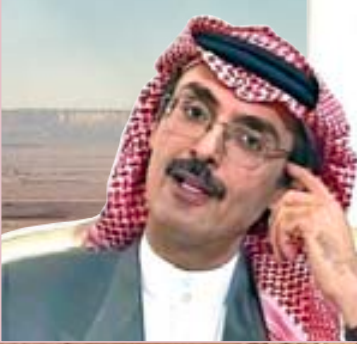
شعر : الأمير بدر بن عبد المحسن