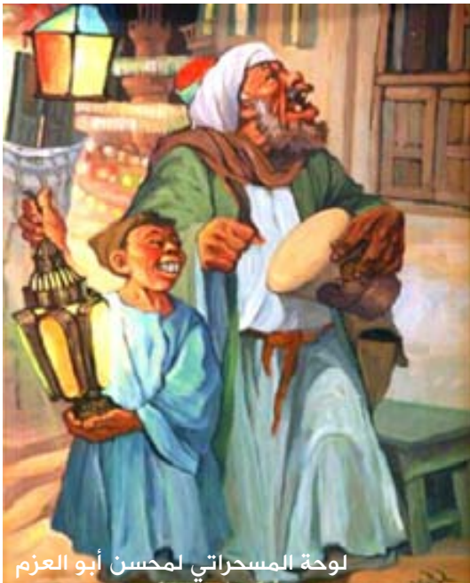
لوحة المسحراتي لمحسن أبو العزم