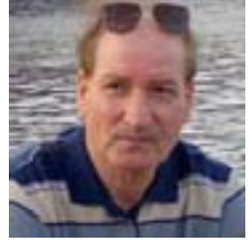
اختيار وإعداد: باسم العربي