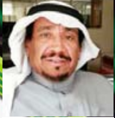
شعر: راشد بن جعيثن