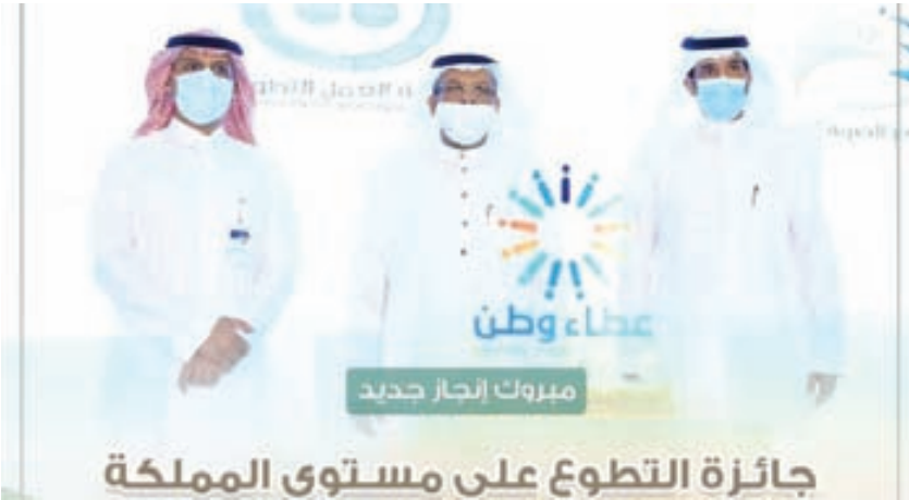
وزير الموارد البشرية يُكرم مراكز أحياء جدة كشريك في إنجاح يوم التطوع السعودي والعالمي

المهنة وتأهيل الشباب مهنيًا، والمساهمة في توظيف شباب الحي في مؤسسات القطاع الخاص، وقد نفذ مشروعين هما: مشروع التمكين المجتمعي (مكّن)، ويتضمن مجموعة من الدورات التدريبية وورش العمل التي تساهم في تطوير وتأهيل مهارات وقدرات أفراد الحي في مجالات مختلفة تساهم في تطوير الإنسان القوي الأمين، ومشروع التوظيف الذي يهتم بتأهيل الشباب لسوق العمل، ويسعى لتأمين الفرص الوظيفية الدائمة والجزئية بالتنسيق مع مؤسسات القطاع الخاص.