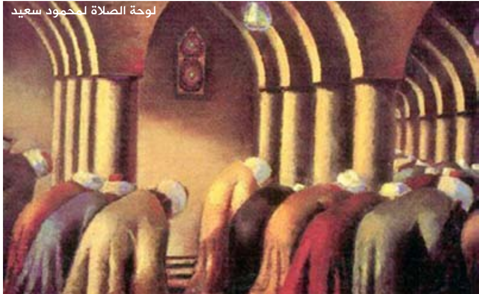
لوحة الصلاة لمحمود سعيد

يغلب الطابع الديني على لوحة الصلاة للتشكيلي محمود سعيد، وهي الأقرب إلى مخيلة الجميع عند استذكار الأعمال والرسومات التشكيلية الخاصة بالإسلام ومفهوم الديانة والخشوع. هذا الجانب المشرق المتوهج يضيف للفن ميزات، تدرج ضمن الأصل والتأصيل، والمدركات الإسلامية الخاصة. فما أجمل من التعبير عن الإيمان أكثر من المصلين في المسجد؟! فضيلة تقوم على الخشوع