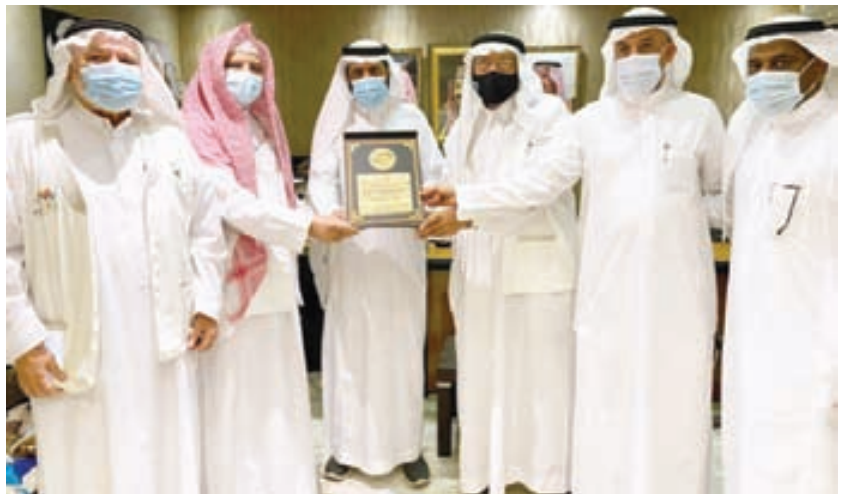
الجمعية تنال جائزة مكة للتمييز في دورتها الـ 12

عالية المستوى، كما تسعى مراكزها أن تكون متنفساً ومكاناً آمناً تستثمر فيه طاقات سكان الحي لتحقيق الأمن