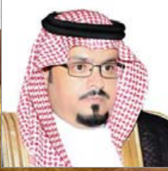
شعر: د. علي بن محمد السواط*