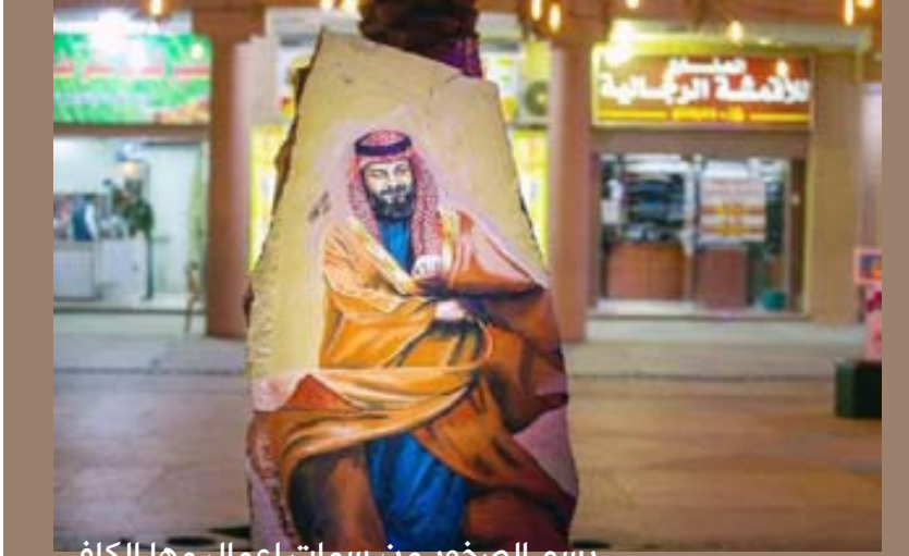
رسم الصخور من سمات أعمالها الكافي

في تفاصيل اللوحة مساحتها 150م 2 -120م رسمها الفنان منذ أربعة شهور. اختار الفنان إبراهيم الألمعي الرسم بالسكين عبر اللون الزيتي، بالأسلوب التنقيطي. استخدم فيها الألوان الزاهية المتموجة القريبة إلى الفسيفساء الصغيرة لكنها في الحقيقة عبارات عن ضربات سكين خفيفة الظل نسجت بتلقائية وحرفية عالية حتى كوّنت اللوحة وصوّرت تفاصيل الجهة اليمنى من وجه سموه. عمل الألمعي بشكل كثيف على التفاصيل في أظهار جمالية البساطة بين اللون والأسلوب. وبذلك استطاع الألمعي أن يحقق هدفه الأسمى من رسمه ألا وهو التفاعل بين الصورة والمتلقي، ويخلق بيئة إنسانية فنية جذابة قيما بينهما! حيث بات ولي العهد بريشته أيقونة الفنون.