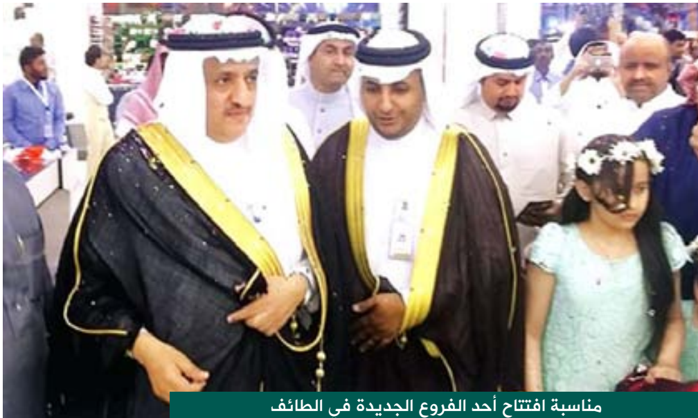
مناسبة افتتاح أحد الفروع الجديدة في الطائف

حفظه الله - يمتلك هذه الميزة بالفطرة، والغريزة المبكرة، وإذا تحدثنا عن عبقرية الأمير محمد بن سلمان، فلا غرو، فقد تربى في مدرسة والده القائد الملهم الفذ سيدي خادم الحرمين الشريفين الملك سلمان بن عبدالعزيز - حفظه الله - وهو المعروف طوال السنين التي قضاها في خدمة البلاد والعباد بالحكمة السديدة والسياسة الرفيعة والإدارة الحكيمة، ولا عجب أن