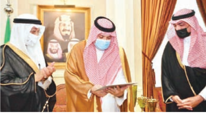
الأمير مشعل بن ماجد يلتقي ويكرم رؤساء مراكز الأحياء المتميزة بمحافظة جدة