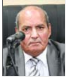
عرض: د. محمد صالح الشنطي