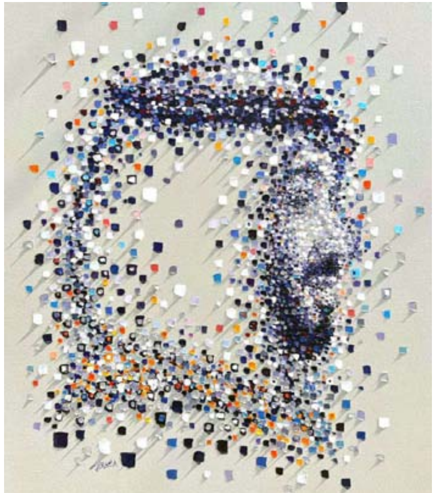
لوحة إبراهيم الألمي... بضربات السكين المتموجة

جانبه حماسة السلام ترفرف بجناحيها حوله حاملة معها نواياها الحسنة ورؤياه الصائبة. لا بد من الإشارة إلى ان أعمال