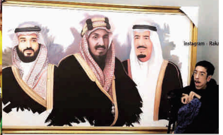
لوحة للفنان الموهوب، راكان كردي، قيادة حكيمة لوطن عظيم

بمهرجان سوق عكاظ في دورته الحادية عشر، جذبت لوحة للفنانة التشكيلية "عهود المالكي" الأنظار، عندما أبدعت في رسم صورة خادم الحرمين الشريفين الملك "سلمان بن عبد العزيز" مرتديا العقال المقصب، وذلك بإستخدام فن الرسم بالقهوة، وهي الصورة التي تداولها الكثير من المغردين على نطاق واسع عبر شبكات التواصل الاجتماعي، معبرين عن حبهم لخادم الحرمين الشريفين، ومبدين إعجابهم الشديد بفخامة اللوحة وجمال إتقانها وإخراجها. من جهتها فإن الفنانة "نبيلة أبو الجدايل"، قد خطفت الأنظار قبل أشهر قليلة بلوحاتها التي تجمع الملك المؤسس عبد العزيز آل سعود مع الملك سلمان وولي العهد الأمير محمد، فلوحة "رؤية 2030" ولوحة "تحالف المجد" تظهران الأجيال الثلاثة في تناغم فني بديع، وقد حظيت اللوحات بمتابعة وتداول كبير بين مستخدمي مواقع التواصل الاجتماعي. كل هذه الأعمال الفنية تجسد معاني الحب والوفاء والإخلاص للوطن، فهؤلاء الفنانون قد نفذوا أعمالهم حباً في وطنهم وملوكهم، مطلقين الفرشاة والأقلام لتعبر وتفصح عن هذا الحب، مهئين ومشاركين في هذا العرس الوطني، وتبقى أعمالهم علامات خالدة ومضيئة في حب وطن كريم وقيادة أمينة وشعب وفي، كما إنها تبرز أيضاً مدى ثراء الفن السعودي وغناه.