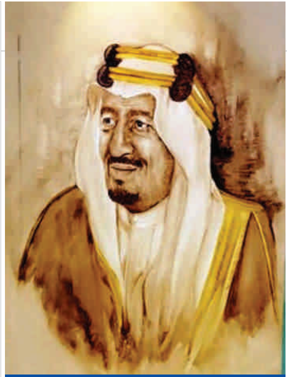
صورة للملك سلمان مرسومة بالقهوة والماء، للفنانة عمود المالكي