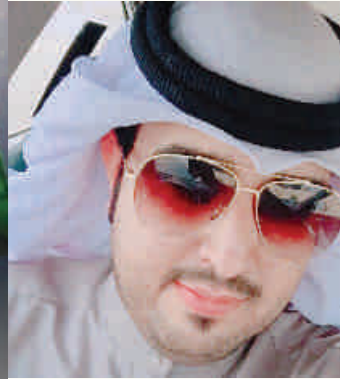
شعر / يوسف الرحيلي