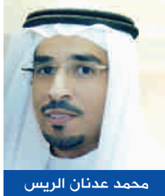
محمد عدنان الرئيس

بمهرجان سوق عكاظ في دورته الحادية عشر، جذبت لوحة للفنانة التشكيلية "عهود المالكي" الأنظار، عندما أبدعت في رسم صورة خادم الحرمين الشريفين الملك "سلمان بن عبد العزيز" مرتديا العقال المقصب، وذلك بإستخدام فن الرسم بالقهوة، وهي الصورة التي تداولها الكثير من المغردين على نطاق واسع عبر شبكات التواصل الاجتماعي، معبرين عن حبهم لخادم الحرمين الشريفين، ومبدين إعجابهم الشديد بفخامة اللوحة وجمال إتقانها وإخراجها. من جهتها فإن الفنانة "نبيلة أبو الجدايل"، قد خطفت الأنظار قبل أشهر قليلة بلوحاتها التي تجمع الملك المؤسس عبد العزيز آل سعود مع الملك سلمان وولي العهد الأمير محمد، فلوحة "رؤية 2030" ولوحة "تحالف المجد" تظهران الأجيال الثلاثة في تناغم فني بديع، وقد حظيت اللوحات بمتابعة وتداول كبير بين مستخدمي مواقع التواصل الاجتماعي. كل هذه الأعمال الفنية تجسد معاني الحب والوفاء والإخلاص للوطن، فهؤلاء الفنانون قد نفذوا أعمالهم حباً في وطنهم وملوكهم، مطلقين الفرشاة والأقلام لتعبر وتفصح عن هذا الحب، مهئين ومشاركين في هذا العرس الوطني، وتبقى أعمالهم علامات خالدة ومضيئة في حب وطن كريم وقيادة أمينة وشعب وفي، كما إنها تبرز أيضاً مدى ثراء الفن السعودي وغناه.