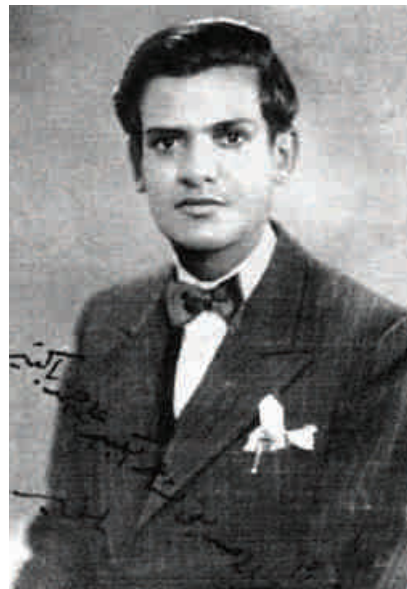
الشيخ عبدالله بلخير في شبابه

فصارت لدى هذا الشاب العصامي رغبة في استعادة تلك البلاد والأمجاد، وبدأ يفكر في السبيل إلى العودة وترك الكويت، فبدأ في استشارة والده، وكان الملك عبدالعزيز يحب والده حباً جمّاً، كما أمرنا الله في القرآن «فَلَا تَقُلْ لَهُمَا أَقِيٌّ»، وكان الملك عبدالعزيز في تلك الأيام بالكويت كانوا يسمونه