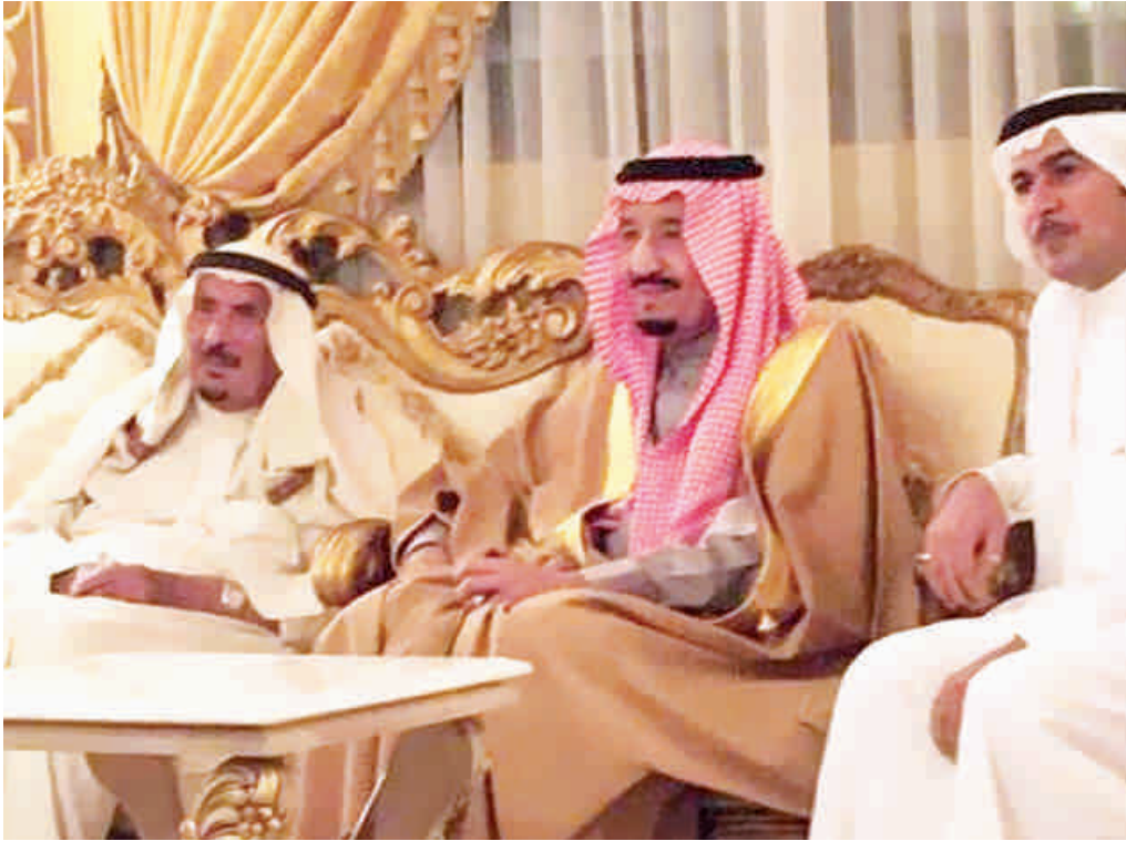
الملك سلمان في زيارة الشيخ ثنيان بن فهد الثنيان