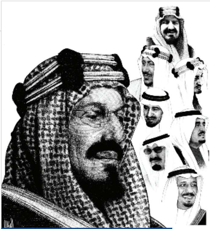
لوحة القيادة، للفنان محمد عدنان الرئيس