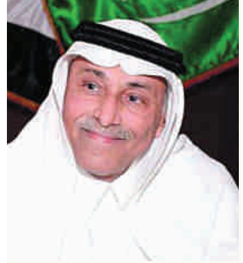
شعر / أحمد الحربي

وَطَنِي أَنْتِ بِالْمَحَبَةِ أَحْرَى فِيكَ نَبْضُ الْقُلُوبِ يَخْتَالُ سِحْرًا كَمْ رَسَمْنَا عَلَى ثَرَاكِ الْأَمَانِي نَابِضَاتٍ بِالْحَبِّ مَغْدَى وَمَسْرَى نَسَكَبُ اللَّحْنَ فِي الْكُؤُوسِ أَمَانًا وَعَلَى «ثَغْرِنَا» الْحِكَايَاتِ، أُسْرَى طَلَعَتْ كَالشَّمُوسِ أَنْقَى سِنَاءً وَغَدَا تَشْرِقُ الْعَنَاوِينَ بُشْرَى نَجْمَةٌ كَالْعُرُوسِ دَلًّا وَغُنْجًا وَجَمَالَ الْبُكُورِ ، يَخْتَالُ بِكِرَا رُوحَهَا فِي «جَلَالَةِ اللَّهِ» رُوحًا وَعَلَى رَمَشِهَا .. الْغَوَايَاتُ سَكْرَى نَبْضُهَا فِي النَّهَارِ حَبًّا وَعَشْقًا ضَوْعُهَا فِي الْمَسَاءِ مَسْكَأً وَعِطْرًا مَوْطَنِي .. بَيْنِنَا عِتَابٌ قَدِيمٌ غُضُّ طَرْفًا ، فَأَنْتِ وَاللَّهِ أَدْرَى .. عَيْدُنَا الْيَوْمَ .. أَنْتِ .. أَغْلَى الْأَمَانِي إِنْ تَلَمَّسْتِ لَلْمُعَاتِبِ عُذْرًا فِي عَطَايَاكَ يَا كَرِيمَ السَّجَايَا كُلَّ حَرْفٍ يَفِيضُ شِعْرًا وَنَثْرًا فَالْحِكَايَاتُ فِي شِفَاهِكَ جَذَلَى وَالرُّوَايَاتُ فِي جَبِينِكَ تَتْرَى وَاللِّيَالِي عَلَى ثَغُورِ الْأَيَامِي بِاسْمَاتِ فِدَا لِيَالِيكَ ذُخْرًا وَالصَّبَاحَاتُ وَجْهَهَا الْغُضُّ نَبْضًا كُلَّ نَبْضٍ يَضِيءُ لِلْحُبِّ فَجْرًا وَالصَّبَايَا عَلَى الْأَرَائِيكِ يُغْزَلْنَ حُيُوطَ الْحَيَاةِ ، فِعْلًا وَطُهْرًا إِنْ مَهْدِنَا عَلَى السُّوَالِفِ حُسْنًا أَوْ نَثْرِنَا عَلَى الْمَفَارِقِ ظَفْرًا وَالشَّبَابُ .. الشَّبَابُ فِي كُلِّ نَادٍ يَذْرَعُونَ الْحَيَاةَ بَاعًا وَشَبْرًا حُلْمُهُمْ بِاسْطِ ذِرَاعِيهِ يَدْنُو كُلَّ يَوْمٍ يُغَيِّبُ الْيَوْمَ عُمْرًا إِنْ كَتَبْنَا ، فَمَا كَتَبْنَا كَثِيرًا أَلْفَ سَطْرِ يَمِيسُ بِالْحَبِّ سَطْرًا