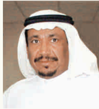
شعر : راشد بن جعيثن

من طمع عقب أبوتركي بنجد (مهبول) حكمة يشهد الحاضر بمدلولها ويقول بندر بن سرور رحمه الله: