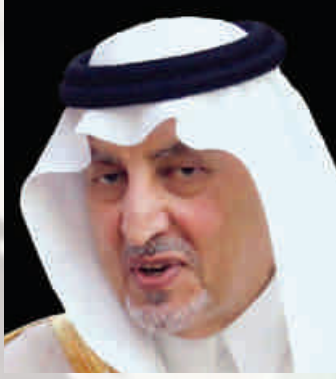
شعر : الأمير خالد الفيصل