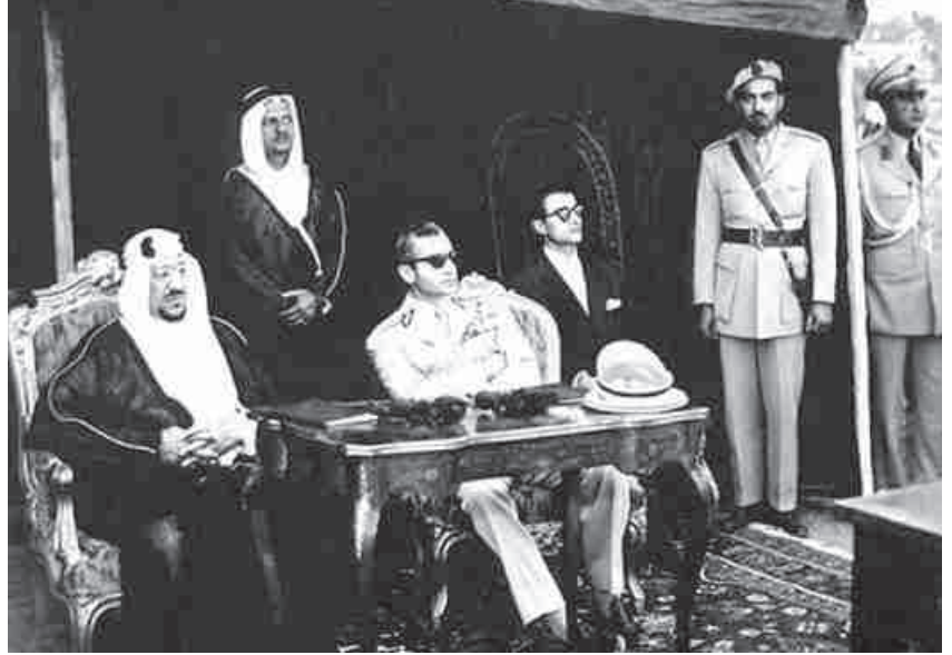
الشيخ بلخير مع الملك سعود في استقبال محمد رضا بهلوي

** حركة الابتعاث انطلقت بعد الملك عبدالعزيز، السبيل إليها كان إلى القاهرة، ولكن صادف عندنا وزير ومستشار وشخصية عربية