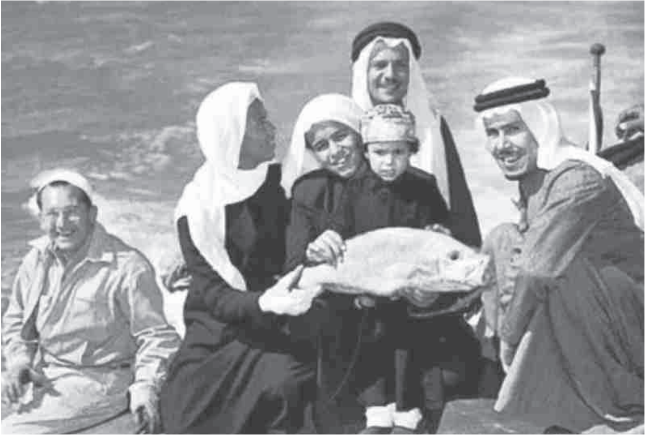
.. مع الأمير فيصل بن تركي بن عبدالعزيز والأمير محمد بن سعود والأمير منصور بن سعود في شواطئ جدة

أنا ومعني الشيخ سليمان الحمد، ابن أخي وزير المالية الشيخ حمد السليمان، إلى هناك لأول مرة، هو مَر على بيروت، وبعد أن سمع الملك يقول لماذا لا تبعثوا هذا الولد، وأكاد الآن أزعج بدون أي شيء من التباهي أو الفخر أو الافتراء، بأنني أنا الوحيد الذي قال عنه الملك عبدالعزيز اذهبوا وعلّموا هذا، لأنه بعد ذلك جاءت مواكب من طلاب العلم من المملكة العربية السعودية، وتم تأسيس مدرسة اسمها مدرسة تحضير البعثات، ويكاد الفضل كله يرجع إلى هذه المدرسة.