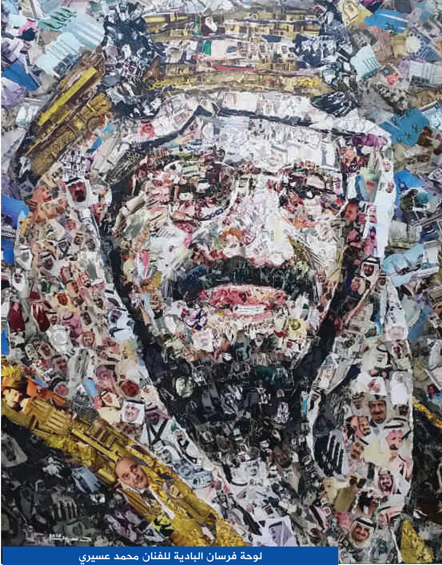
لوحة فرسان البداية للفنان محمد عسييري