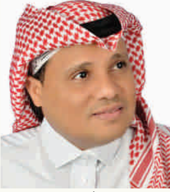
شعر: إبراهيم أحمد آلوش*