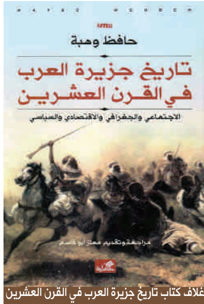
غلاف كتاب تاريخ جزيرة العرب في القرن العشرين

عن أهل العلم خوفاً من غضب الله عليهم، وأغلبهم لا يحلف بالله كاذباً مهما كانت العقوبة، والبدوي يفلت بمهارة من الإجابة عندما يُسأل، ولكن إذا طلب منه اليمين اعترف بجرمه إن كان مذنباً، ويعلق الكاتب أن هذا أمر يدعو إلى الغرابة والإكبار وكذلك يمدحهم بعد التهم في توزيع الغنائم وعدم اعتداء أحد منهم على حق أخيه البدوي، وكذلك يرى أن البدوي يمارس