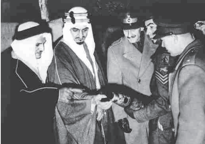
الشيخ بلخير برفقة الملك فيصل في إحدى رحلاته

تلك الأيام، تقريباً في سنة 1345هـ، ولا أزال أتذكر أنه كان يرتدي الزي الأزهري المصري؛ العمامة الأزهرية والجلباب، وإذا ألقى درسه وتعب فإنه كان ينام في حصوة الحرم، فكنا نمر عليه ونستغرب العبء التي كان يلبسها ومن فوقها العمامة الأزهرية، ثم بعد ذلك بدأ يتعرف على طلائع الشباب؛ الشيخ محمد سرور صبان وحمزة شحاتة والعواد، وقد عرف الموجودون في مكة قصته فحفظوا عليه وعرفوا فيه أيضاً محاولته أن يبرز بلاده الكويت، ثم اشتكوا إليه أنهم أيضاً يريدون جريدة هنا، لأن جريدة «أم القرى» التي صدرت في عهد الملك عبدالعزيز في مقابل جريدة «القبلة»