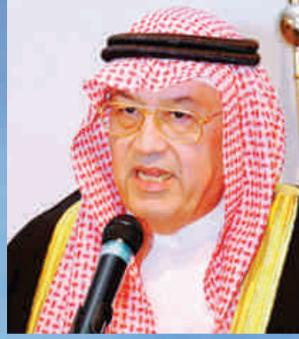
الشاعر / د. غازي القصيبي