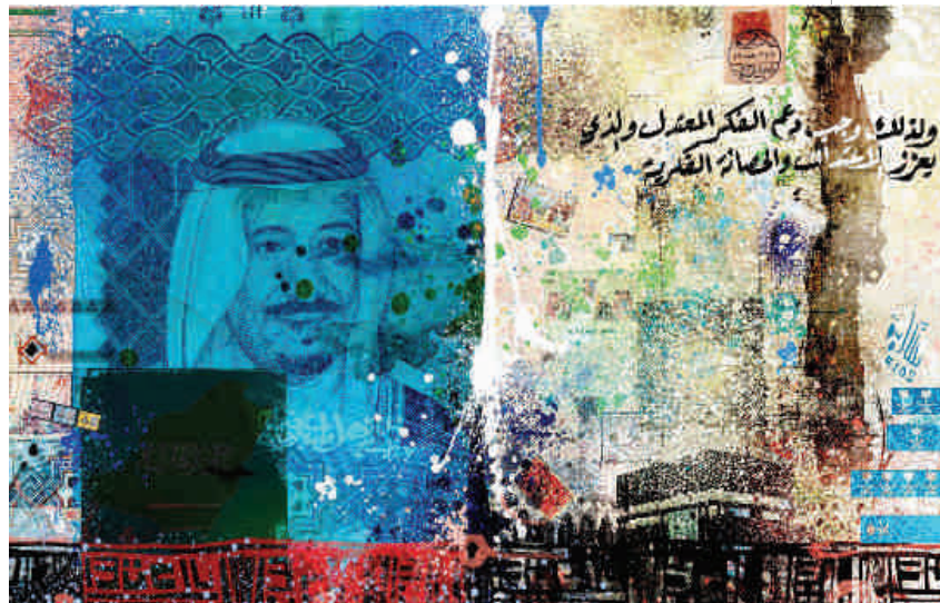
لوحة المنهج السعودي ، فن رقمي ، للفنان د. قماش بن علي