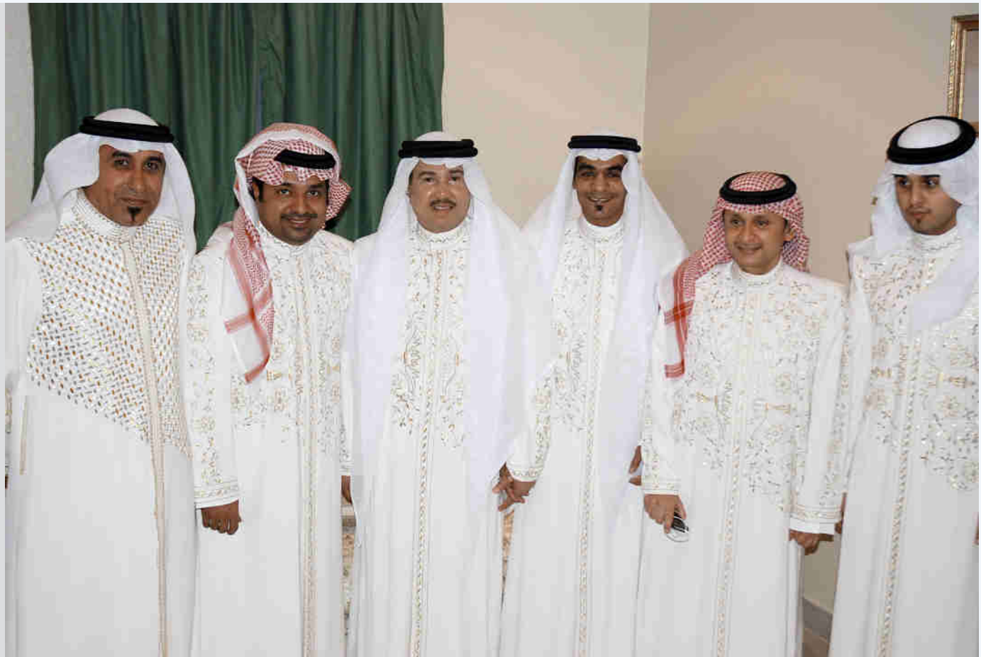
المصمم مع فناني الجنادرية وهم يرتدون ملابس من تصميمه

الشهرة بعد وفاته أكثر من شهرته وهو على قيد الحياة، لقد كان رحمه الله يملك صوت رائع وأخلاق عالية وثقافة كبيرة، ويعيش في بساطة جميلة، وهو بلا شك مؤسس الأغنية السعودية، تابعتُه منذ طفولتي، وتابعتُه في باريس وفي كل حفلاته، وفي عام 1997 كنت محظوظا بالالتقاء به في مهرجان الجنادرية وصممت له أزياء المهرجان على مدى ثلاثة أعوام، وفي كل مرة كانت محبتي له تزداد، واقترب منه كطلال الإنسان قبل الفنان، وأعتقد أن الإنسانية أعلى سمو يصله الشخص في حياته أكثر من أي شيء، وطلال نال هذا السمو وتجاوزه، وذلك سبب حب الناس له بعد وفاته، حيث يترحمون عليه