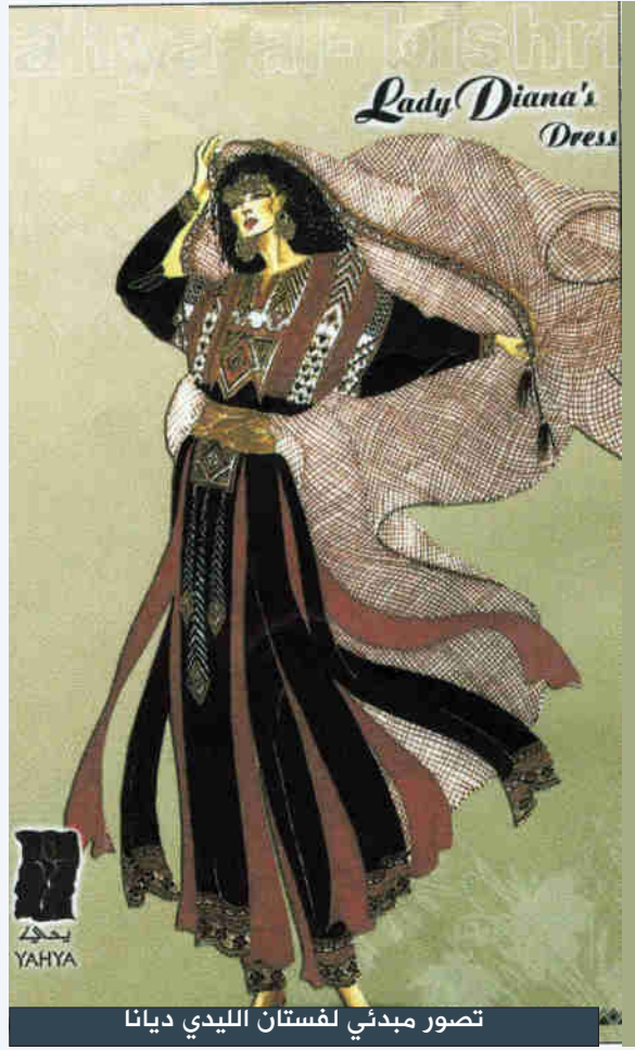
تصور مبدئي لفستان الليدي ديانا

هناك ما يلفتك بقريتك أو بمنطقة عسير ويملك بأفكار حديثة للتصميم؟ لا زال هناك الكثير والكثير مما يلفتني في قرانا، وفي وطني بشكل عام الذي يحتضن الكثير من النقوش التراثية، وسأقدم المزيد، وكنت سأعمل هذا العام على مجموعة مستوحاة من الخط العربي ولكن ظروف كورونا أوقفت مجموعتي، والآن أعمل على مجموعة لمدينة العلا، عن حضارات اللحيانيين والديدانيين والأنباط وصولاً إلى الحضارة الإسلامية، وبإذن الله ستكون هي المجموعة الجديدة، وستكون خاصة بالمتحف وليست مخصصة للبيع. *بادرت مؤخراً بإيقاف شركتك في تركيا رفضاً لسياسة أوردوغان ضد