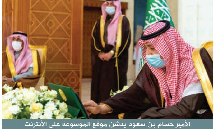
الأمير حسام بن سعود يبدش موقع الموسوعة على الإنترنت