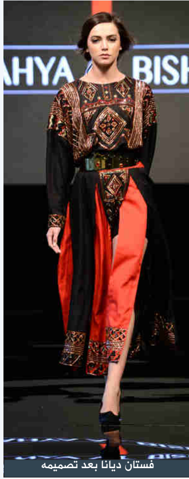
فستان ديانا بعد تصميمه