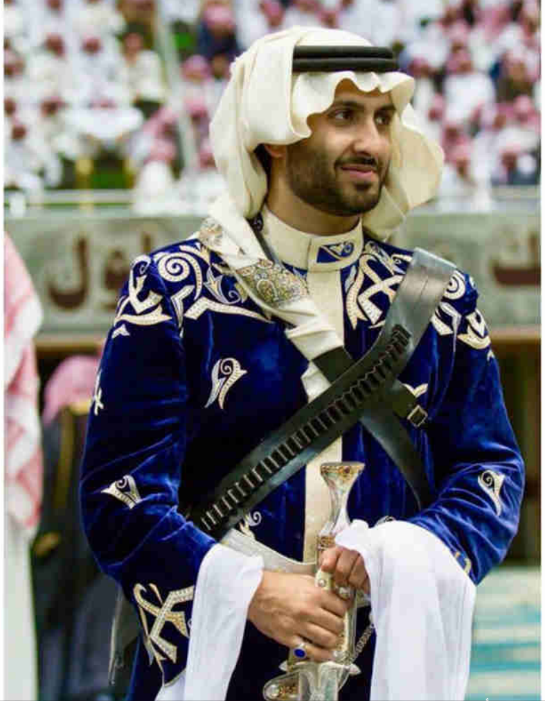
الأمير فيصل بن عبدالمجيد يرتدي «دقلة» من تصميم البشري

أي عمل فني كان يجد معارضة من المجتمع، وكنت أعرف منذ بدأت الدراسة في هذا المجال بأني سأواجه صعوبات كثيرة، ولكن إيماني بهذه المهنة وشغفي بالموضة كانا حافزاً لي في تخطي هذه الصعوبات.