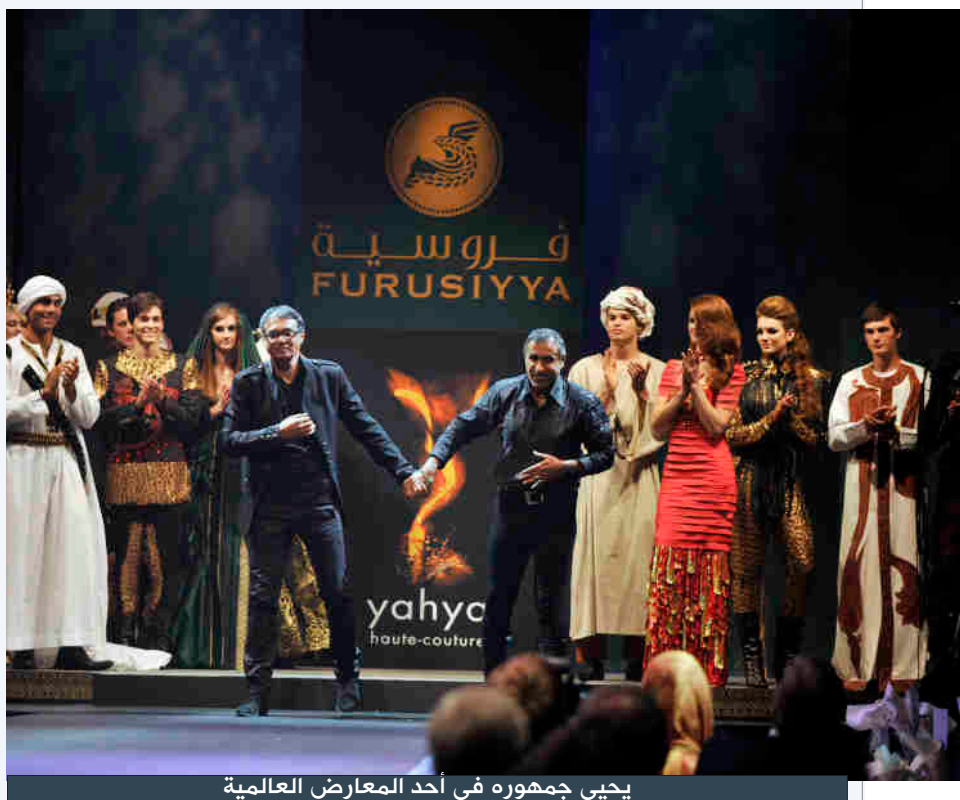
يحيي جمهوره في أحد المعارض العالمية

الشهرة بعد وفاته أكثر من شهرته وهو على قيد الحياة، لقد كان رحمه الله يملك صوت رائع وأخلاق عالية وثقافة كبيرة، ويعيش في بساطة جميلة، وهو بلا شك مؤسس الأغنية السعودية، تابعتُه منذ طفولتي، وتابعتُه في باريس وفي كل حفلاته، وفي عام 1997 كنت محظوظا بالالتقاء به في مهرجان الجنادرية وصممت له أزياء المهرجان على مدى ثلاثة أعوام، وفي كل مرة كانت محبتي له تزداد، واقترب منه كطلال الإنسان قبل الفنان، وأعتقد أن الإنسانية أعلى سمو يصله الشخص في حياته أكثر من أي شيء، وطلال نال هذا السمو وتجاوزه، وذلك سبب حب الناس له بعد وفاته، حيث يترحمون عليه