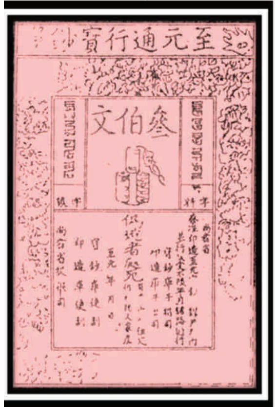
عملة (اليالشت) الورقية في زمن زيارة ابن بطوطة للصين