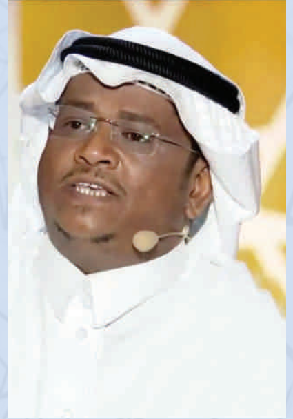
شعر : سلطان السبهان

نُبئت على سفح انتظاري وشوسنة والشوق أقلق بالتردد مجلسه أتجيب؟ أم بتلات عمري تنقضي في الـ "لاتجيب" تحير ما أبأسه! أقسي الخسارة أن تؤمل في الهوى وتعود، كفك من حبيبك مفلسة! أكون رُوح في الحياة عذابها وتكون في نفس الحياة المُنسنة؟ سأت كفوف وداعها من غمدها ثم امتطت خيل الفراق مغلسة واستبقت الذكرى فيالتذكر يستل من عمر ارتاحي أنفسه و يزوذي حيناً تبسّم خاطر و بزحمة الأحزان تنبت نرجسة عيناي تنظر لليمين وضكّتي صوب الشمال بريئة متوجسة يا أنت يا روحاً يرواؤها الندى عن لطفها و تحار فيها الأقيسة تدريين يا دنيا العبير؟ قصائدي مذعنت فيها لم تزل متغطسة أدري بأن الشعير صيف كاذب و تناقضات جمعتها الأباسه وغصون أمال يسرك طلعها مع أنّها في تربة متيبسة لكنه في زمهرير ترقبي يا أمنياتي أمنيات مشمسة يا أجمل الأشياء حين تجيننا في حينها رغم الظنون المبلسة عدب حميمك فارحلي أو فامكثي في الحاليتين: تولهي لن أحبسه إن غبت: أسرفت الصبابة في دمي أو جئت: هذا الشوق يملأ مجلسه أنا ما عشقتك مَبسماً ولوإحظاً فتانة وحواباً متقوسة أنا طررت روحاً والتقيتك في السما ورأى هوانا في العُلا متنفسه فذهب أحياناً الحب ملء بداوتي ومضيت في قتل الظنون لأحرسه ما كنت أفهم أن دمع عيوننا ثمن لطيش نفوسنا المتحمسة حين التقينا قلت: " ما أحلى الهوى " وصرخت يوم فراقنا: " ما أشرسه " عجباله متسأل ما أفلحت جدرائنا في أن ترد تجسسه الحب هندسة لفوضى ثرثرت فينا طويلاً وهو فوضى الهندسة