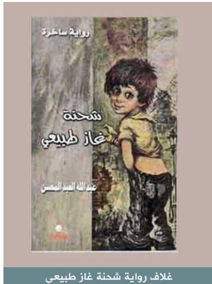
غلاف رواية شحنة غاز طبيعي

للتذكير: فإن صاحب هذه المقولة مؤلف كتابين شهيرين هما «قلق السعي إلى المكانة» و«عزائم الفلسفة».