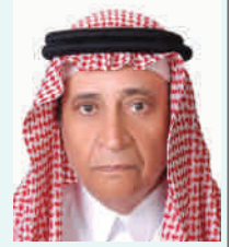
أ.د عبدالله الشعلان