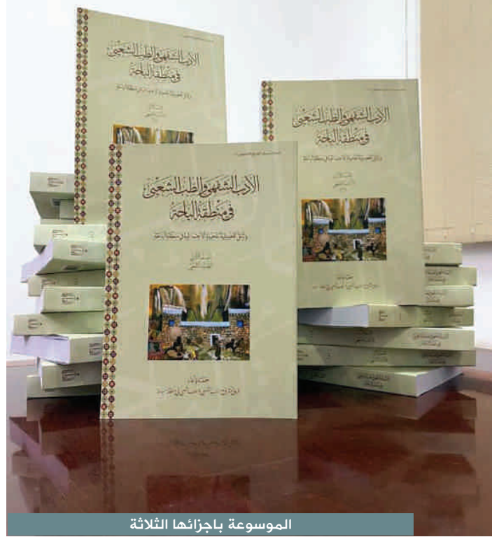
الموسوعة بأجزائها الثلاثة

وإني لنجمٌ تُهتدي ضحبتني به... إذا حال منْ دونِ النجوم سحابٌ