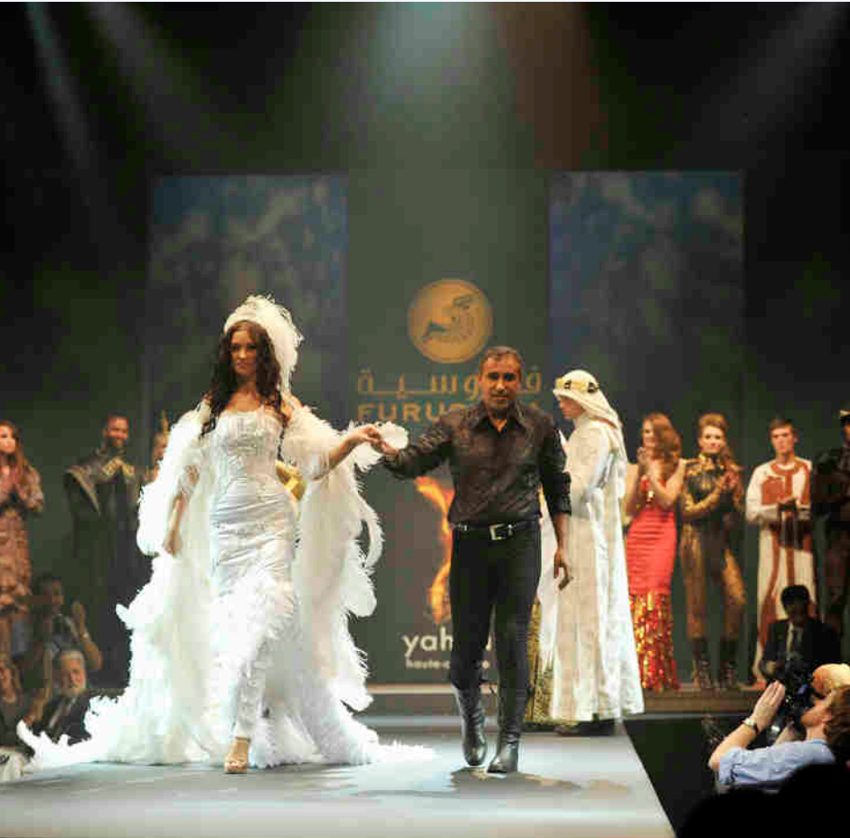
من تصاميم البشري في معرض فروسية