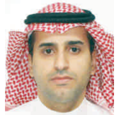
عبدالله بن يعلى