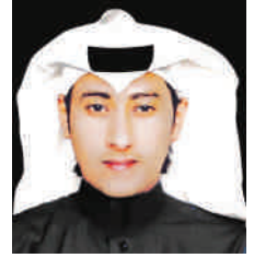
فایع آل مشیره عسیری

تشكل القصة القصيرة بشكل عام دوراً هاماً ورئيساً في قدرتها على التكيف مع التحولات المجتمعية النامية منها والسريعة وتمتد قدرتها الكبرى في مطاردة المتغيرات وترويض ايقاع الحياة المتسارع فتتجلى بأشكال رائعة ذات طابع فني أنيق متنوع الطرح والقضايا ولعل هذا يظهر واضحاً في القصة القصيرة جداً .. مجلة اليمامة طرحت قضية القصة القصيرة والتحديات التي تواجهها من خلال محور: ” نجاعة القصة القصيرة في مواجهات التحديات ” على مجموعة من كتّاب وكاتبات القصة القصير فكانت هذه الآراء ..