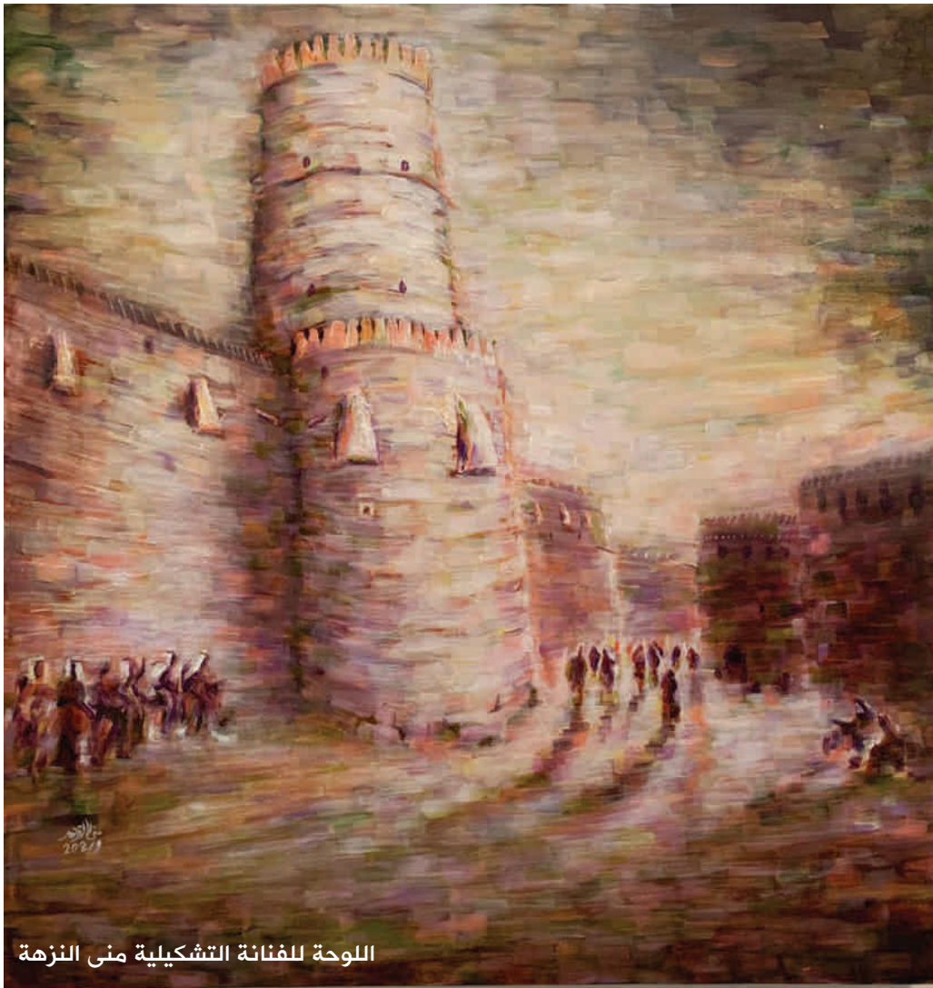
اللوحة للفنانة التشكيلية منى النزهة