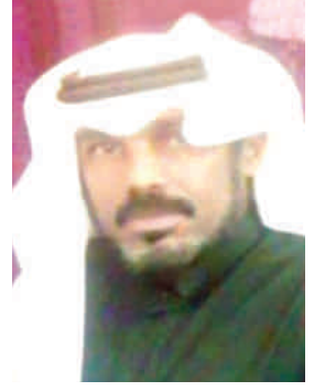
البروفيسور محمد منصور الربيعي

والتباعد الاجتماعي كانت كبيرة، حيث مرت الأيام الأولى ممتزجة بالحيرة والقلق ومحاولة عشوائية من قبل المجتمع في اجتياز هذه الفترة بالطبخ واللعب والرياضة في أماكن محدودة وبطرق بسيطة ونظراً للعزلة الإلكترونية التي أدت إلى تباعد الأسر روحياً بحيث أعادت كل أسرة اكتشاف أفرادها ، فبدأت الأسر وكأنها عائدة من رحلة طويلة جعلتهم يتلمسون ملامح بعضهم ويعيدون التواصل الفعال لم يكن لدي بعض الأدباء الوقت الكافي لكتابة رواية للحساسية الأدبية لديهم وانتظار لحظة البدء والتي قد تكون بعد الخروج من أزمة كورونا ، فانتكشت الساحة الأدبية لفن يفرض نفسه من حيث القصور والتكثيف وبقية الفنيات لدي من يمتلكها لتعبر عن هذه الأزمة وتوثق أحداثها وتبرز بوضوح نحو المقدمة جنباً إلى جنب مع القصة القصيرة وقصص الطفل.