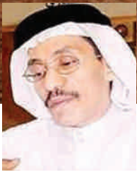
شعر / الحميدي الثقفي

أمعنت في مدّ الخُطى لين حثّيت ركايب الهاجوس تمشي عواري حتّى بدا لك صباحها واستهلّيت مجلس وديباجه وعود وجواري! شَحّ الغنا قُلت إبكني! قِلت: ياليت واقفيت أنا تصفق يميني يساري في قَمّة الخُذلان والحزن غنّيت داري بما حولي ولاني بداري