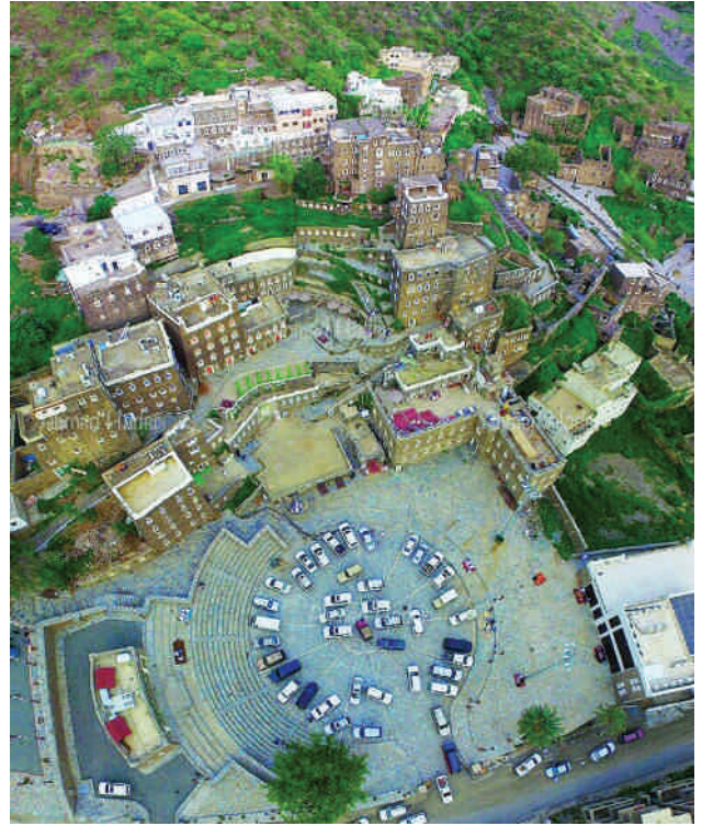
لقطة جوية لمحافظة رجال ألمع