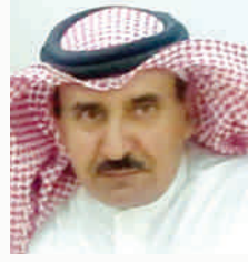
شعر: عبدالله بن أحمد الأسمرى

والغريب أنك أنت من معهم، والغير هو من غاب!!