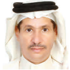
عرض : حمد حميد الرشيدي