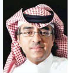
شعر: عبدالوهاب أبو زيد

«انتظرنى» يقول لك الموت، «لن أتأخر!» سأحضرُ في موعدى لنسيرَ معاً في طريق القيامةِ سوف يكونُ لدينا الكثيرُ من الوقتِ كي نتجاذبَ أطرافَ ما أجلته الحياةُ من الكلماتِ وكي نتبادلَ أنخابَ ما سوفته الحياةُ من القهقاتِ ونسكزُ ستهبُ علينا روائحَ مسكٍ وعنبرِ من فراديسِ نائيةٍ، وسنصعدُ في خفةٍ درجَ الغيمِ. سوف نطيرُ ونصعدُ بين الكواكبِ حتى نرى الأرضَ أصغرَ من أن تُرى بالعيونِ ويكونُ لنا ما أردناه في لحظةٍ أن يكونَ سوف تدركُ أن الحياةَ التي كنت تُنشِبُ أظفارَ كفيك فيها لم تكن غيرَ ماءٍ على الرملِ سرعان ما يتبخَّرُ سوف تدركُ أن الزمانَ وأن المكانَ لم يكونا سوى حفرتين وقعتَ بجوفيهما وبأنك حين تبعتَ خطاي، كسبتَ الرهانَ