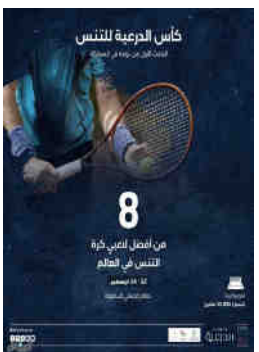
كأس الدرعية للتنس لأفضل ٨ لاعبين في العالم