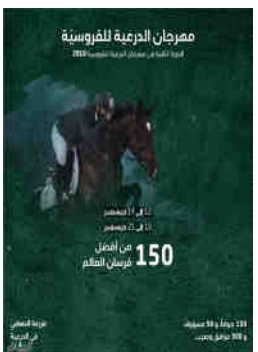
مهرجان الدرعية العالمية