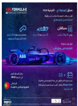
سباق الفورمولا إي