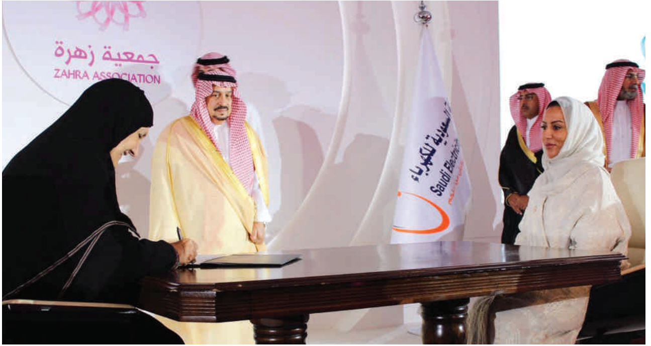
سمو الاميرة هيفاء الفيصل اثناء توقيع احدي الاتفاقيات

ميادة باحارث: تلقيت خبر إصابتي أنا وابنتي بسرطان الثدي في نفس اليوم وأحدث ذلك صدمة كبرى