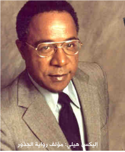
إليكس هيلي: مؤلف رواية الجذور