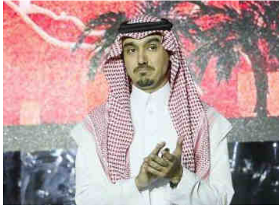
الأمير عبد العزيز تركي الفيصل رئيس الهيئة العامة للرياضة