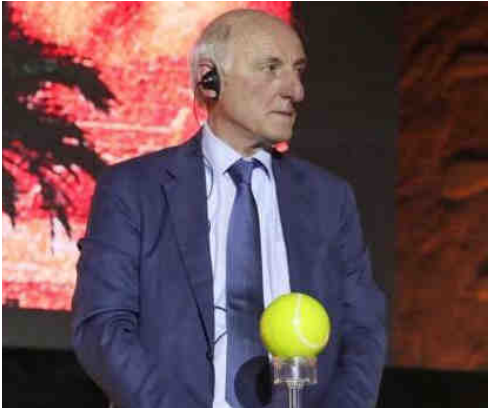
الرئيس التنفيذي لموسم الدرعية