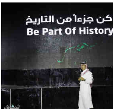
كن جزءاً من التاريخ