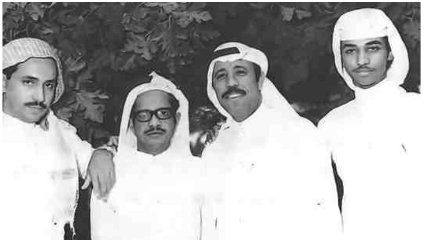
الراحل سراج عمر إلى اليسار وعلى يساره الفنانون طلال مداح وجميل محمود وعبادي الجوهري

يقول محمد سلامة «سألت الموسيقار سراج عمر عن صديقه الراحل طلال مداح وعن مدى افتقاده له فقال : كنت عايش من أجل طلال مداح وكل أعماله له فقد قدمنا ٧٠ عملاً وماخفي كان أكثر بينما لم اتعاون مع البقية إلا بأعمال معدودة.. وبالنسبة لحادثته وفاته التي حصلت اثناء تقديمه لعمل من الحاني