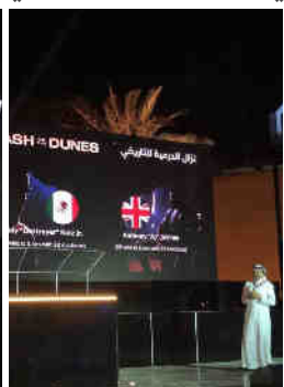
نزال الدرعية العالمي