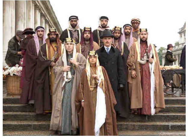
الأمير فيصل والوفد المرافق على مدخل القصر الملكي (من الفيلم)

- بسم الله الرحمن الرحيم أطيب التحيات أنقلها لكم من والدي إلى جلاتكم، وأنقل رغبته في تعزيز الصداقة بين البلدين