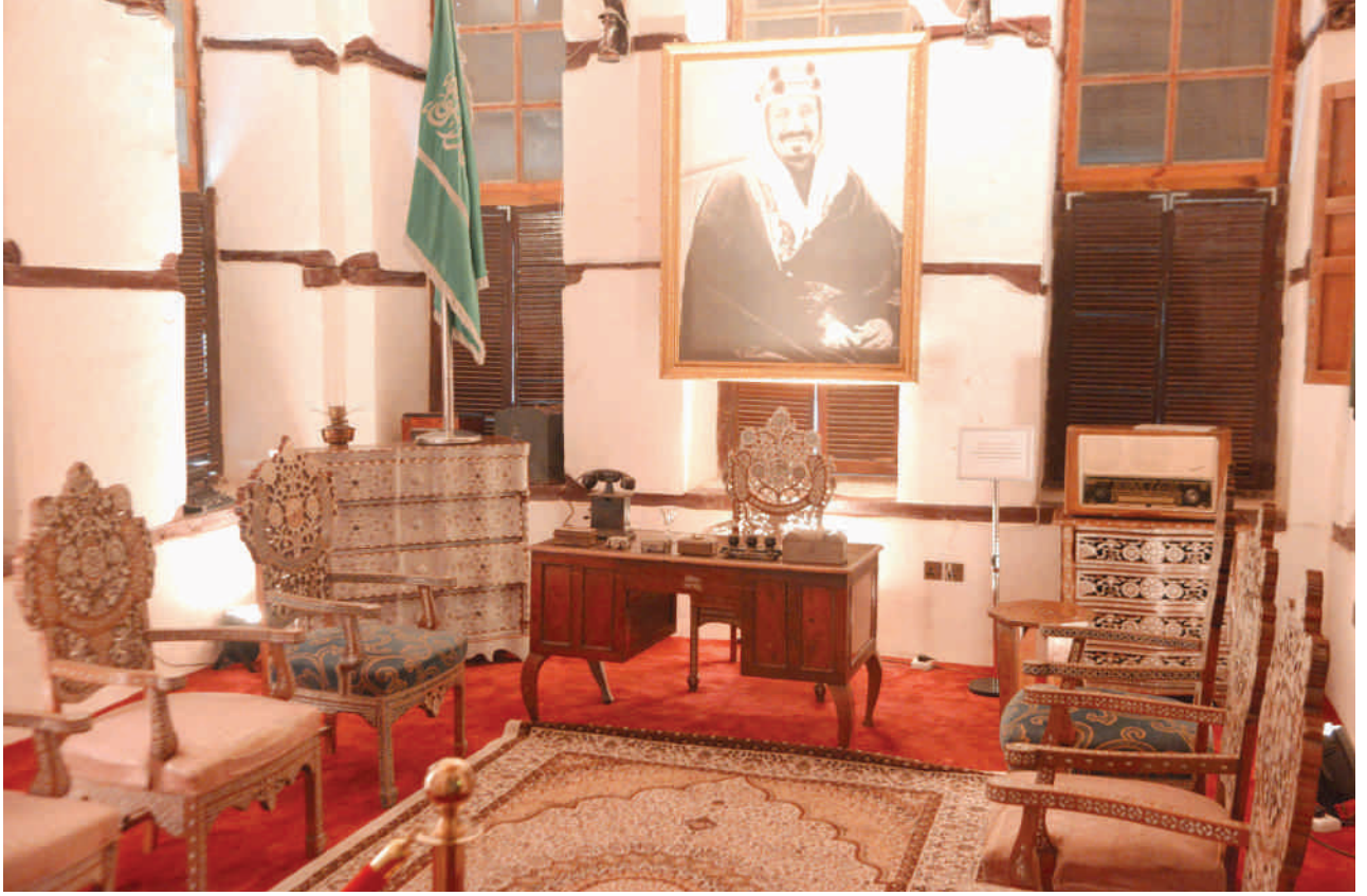
المكتب الخاص بجلالة الملك المؤسس

وزارة الثقافة والإعلام، حينها تم إيكال مهمة الإشراف والمحافظه على «بيت نصيف»، لأمانة مدينة جدة، والتي بدأت ترمم فيه شيئاً فشيئاً، ولكن في الوقت الراهن، أصبح الاهتمام أكبر والحمد لله، بتعاون وزارة الآثار مع الأمانة، ومن خلال تخصيص ميزانية خاصة لأعمال ترميم المنطقة التاريخية بمدينة جدة، ولا أبلغ إن قلت، إن «بيت نصيف» اليوم، يبدو الأكثر حفاظاً على مقوماته ومكتسباته، من ناحية الطراز، والشكل الخارجي، والتقسيم من الداخل.