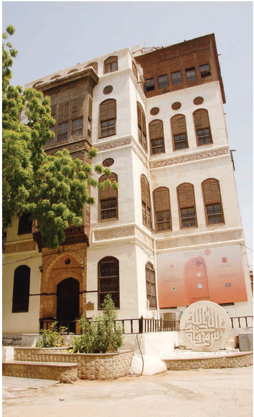
الواجهة الرئيسية لبيت نصيف

يقع «بيت نصيف» في قلب المنطقة التاريخية، واستغرق بناؤه نحو عشر سنوات، بدءاً من عام ١٢٨٩هـ إلى ١٢٩٨هـ. ويعد مالكة وهو الشيخ عمر أفندي نصيف، أحد أعيان آل نصيف الذين يعتبرون من أشهر أسر الحجاز في جدة واستقرت فيها منذ مئات السنين. وحين ضم الملك عبدالعزيز آل سعود الحجاز، كان قصر نصيف مركزاً لإقامة