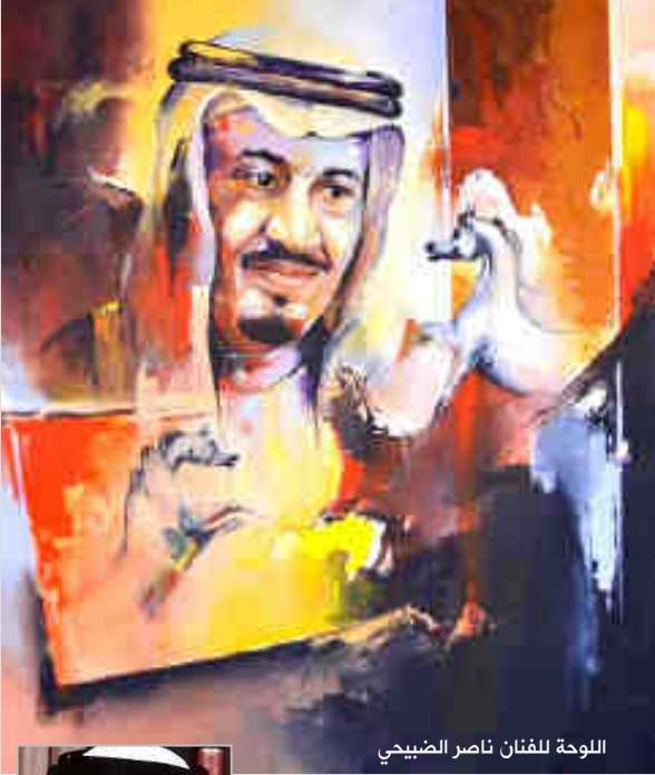
اللوحة للفنان ناصر الضبيحي