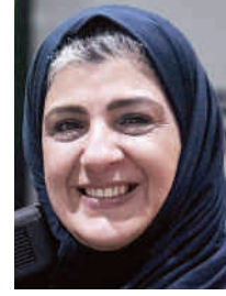
المصورة منال الدباغ