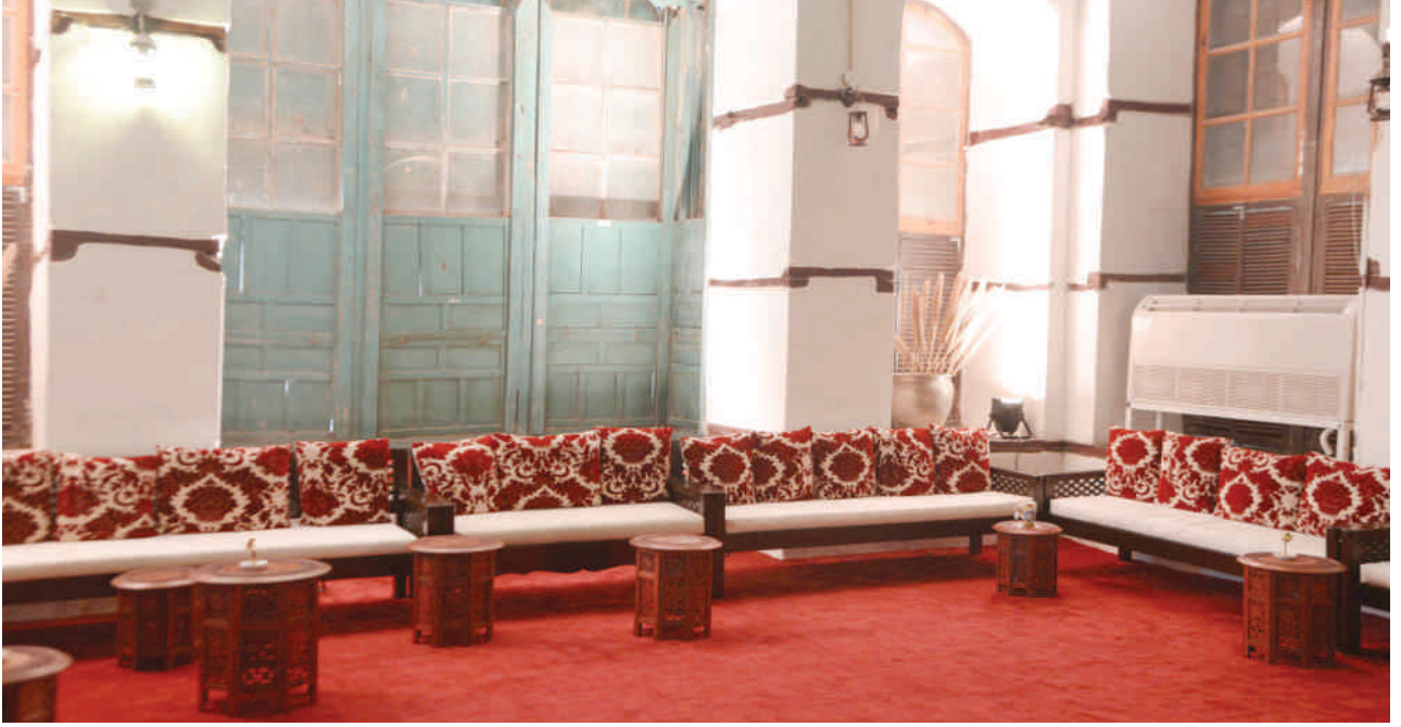
المجلس الخاص بجلالة الملك المؤسس