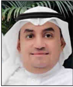
شعر : محمد إبراهيم يعقوب