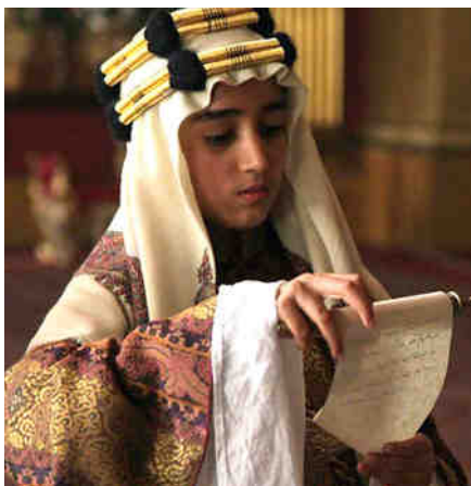
الأمير فيصل ملقياً خطاب والده أمام جورج الخامس

خلال ذلك تدعوه الأميرة ماري إلى رحلة صيد