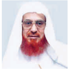
كتبه لكم: أبو عبدالرحمن ابن عقيل الظاهر *