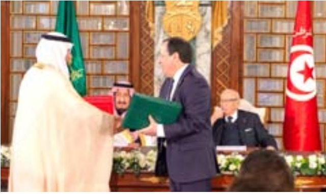
الملك سلمان والرئيس السبسي يشهدان جلسة توقيع المشروعات المشتركة