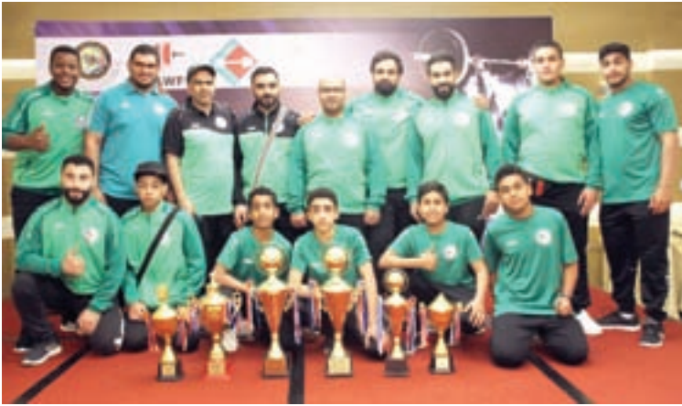
تتويج الأخضر بـ ٦ كؤوس بخليجي وغرب آسيا لرفع الأثقال.

وتكنيكهما المميز الذي شهد به الجميع وفي مقدمتهم الأمين العام للاتحاد الدولي لرفع الأثقال العراقي محمد حسن جلود، فيما كان للرباعين الرجال النصيب الأكبر من الميداليات ليؤكدوا بها علو كعب الأثقال السعودية على المستوى الخليجي والغرب آسيوي، مشددين بأن لقب هذه البطولات هي دافع لتحقيق مزيد من الإنجازات باسم الوطن في البطولات القادمة وأهمها بطولة آسيا للكبار التي ستقام بالصين مطلع الشهر المقبل وبطولة العالم للناشئين تحت ٢٠ سنة بفيجي.