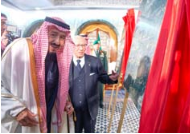
المشروعات تضمنت ترميم