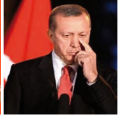
أردوغان خسارة كبيرة

معقله. وتتوسط أنقرة البلاد إقليم الأناضول، وقد جعلها مؤسس تركيا الحديثة مصطفى كمال أتاتورك عاصمة للبلاد منذ عام ١٩٣٢، وهي أكبر مدينة من حيث عدد السكان بعد إسطنبول بتعداد بلغ ٥ ملايين و٤٠٠ ألف نسمة وفق إحصاء عام ٢٠١٧. وإضافة إلى الوزارات والسفارات، تضم أنقرة القصر الرئاسي «شان قايا» الذي كان مقر ١١ رئيساً منذ عهد أتاتورك، إضافة إلى القصر الأبيض الذي بناه أردوغان عام ٢٠١٤، ليصبح بمنزلة رمز النظام الرئاسي الجديد. أما إسطنبول فهي الرئة الاقتصادية وأكبر مدينة من حيث عدد السكان، بتعداد يصل إلى أكثر من ١٥ مليون نسمة وتعد إسطنبول مركز تركيا الثقافي والاقتصادي والمالي، ورمزها الحضاري، وهي الجسر الذي يربط آسيا مع أوروبا. وتعد خسارة الحزب الحاكم في هذه المدينة، أكبر دليل على تراجع شعبية أردوغان؛ إذ يعدها المعقل الطبيعي له على مدار نحو ربع قرن وهي المحطة الرئيسية التي انطلق منها بعدما فاز في الانتخابات البلدية عام ١٩٩٤ وتولى رئاستها حتى ١٩٩٨.