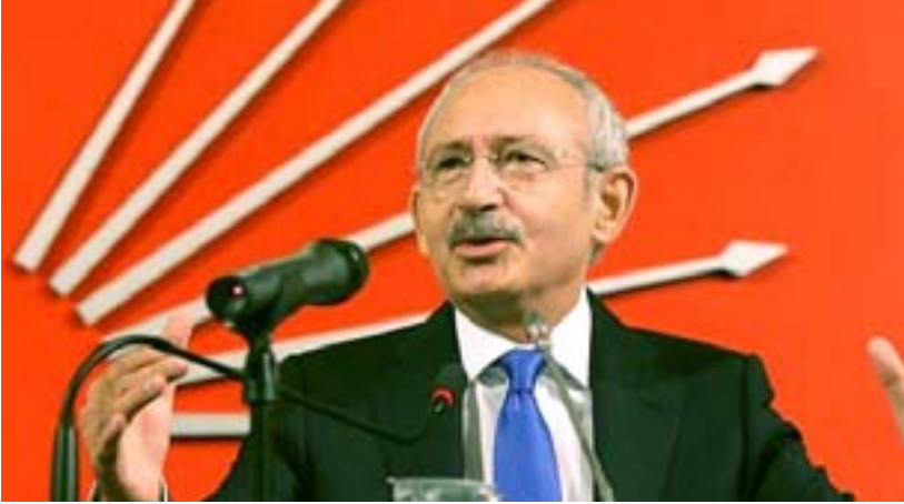
كمال كليجدار أوغلو زعيم المعارضة التركية الرابع الأكبر