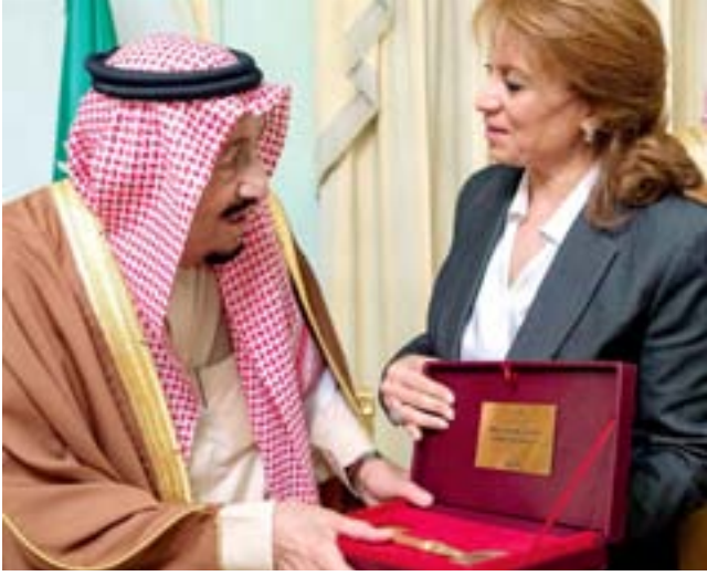
الملك سلمان يتسلم المفتاح الذهبي لمدينة تونس