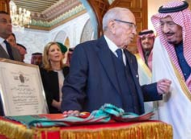
خادم الحرمين يتسلم أعلى وسام في تونس الصنف الأكبر من وسام الجمهورية