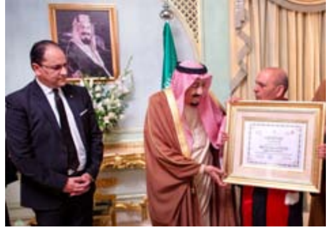
خادم الحرمين يتسلم الدكتوراه الفخرية من جامعة القيروان

وبخصوص قضية الجولان المستجدة قال خادم الحرمين الشريفين: «نجدد التأكيد على رفضنا القاطع لأي إجراءات من شأنها المساس بالسيادة السورية على الجولان، ونؤكد على أهمية التوصل إلى حل سياسي للأزمة السورية يضمن أمن سوريا ووحدتها وسيادتها ومنع التدخل الأجنبي وذلك وفقاً لإعلان جنيف ١ وقرار مجلس الأمن ٢٢٥٤».