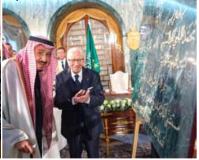
مشروع مستشفى الملك سلمان الجامعي بالقيروان

وطالب البيان بإنهاء الاحتلال الإسرائيلي وفق مبدأ الأرض مقابل السلام، مؤكداً على مركزية القضية الفلسطينية للعرب. وتضمن البيان رفض التدخلات الإيرانية في الشؤون العربية. وأدان استهداف الأراضي السعودية بالصواريخ الحوثية، وأكد أن «أمن السعودية جزء من الأمن العربي».