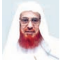
كتبه لكم: أبو عبدالرحمن ابن عقيل الظاهري *

* المُوسِيقَى: تَعْرِيفًا، وَتَدْوِقًا، وَمَعَايِشَةً: