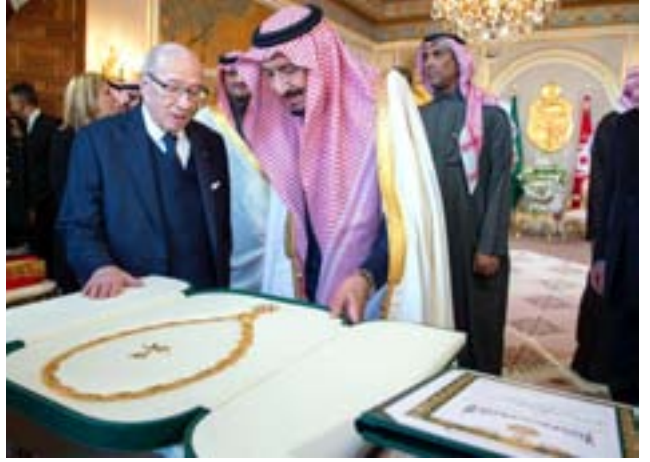
خادم الحرمين يسلم الملك عبدالعزيز للرئيس التونسي