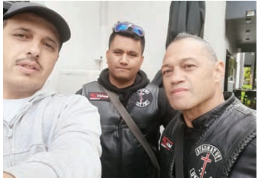
مع عضوين من جماعة الماوري التي تعهدت بحماية المسلمين

جدران المسجد. هنا بدأ المصلون بالتهوؤ والهرب ومع الأسف كان باب مخرج الطوارئ الموجود في الجهة الجنوبية مقفلاً، وكنت جالساً في الجهة نفسها في الصف الثاني بجانب إحدى النوافذ، المصلون تدافعوا نحو الباب ولكن من شدة الذعر لم يتمكن أحد من فتحه وبدأت الأجساد تسقط على بعضها بعضاً، هنا كسرت النافذة وناديت الناس بالخروج منها والحمد لله بلطف من الله تمكنت وغيري من الخروج، ولكن بما أن الجو كان ممطراً ليلة وصباح يوم الجمعة فقد زاد الأمر صعوبة