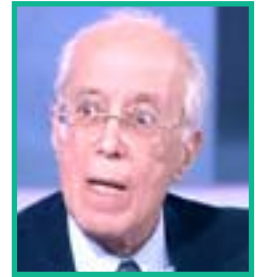
أحمد ونيس وزير خارجية تونس الأسبق