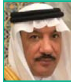
السفير محمد بن محمود العلي