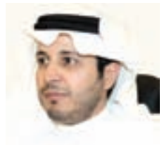
د. منصور المرزوقي

ومثل بن لادن، تنظر الدوحة إلى الرياض كعقبة إستراتيجية كبرى لا بد من التخلص منها وهي تسعى لإزالة هذه العقبة عبر إزالة المملكة العربية السعودية كدولة. وهذا هو بالحرف الواحد ما قاله أمير قطر السابق الشيخ حمد بن خليفة، الحاكم الفعلي من وراء ستار، وزير خارجيته سابقاً الشيخ حمد بن جاسم في تسجيلاتهم مع معمر القذافي عندما تأمروا على تقسيم السعودية إلى ثلاث دول (هنا https://www.youtube.com/watch?v=jfyjx2KQe14 ). وقد حاول الشيخ حمد بن جاسم تبرير هذه المؤامرة في مقابلة تلفزيونية (هنا https://www.youtube.com/watch?v=wT3AKHKtY ).