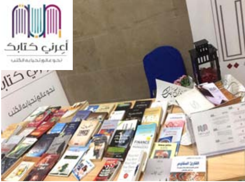
(أعرني كتابك) مبادرة تهدف إلى مشاركة المعرفة بين القراء من خلال إحياء الكتب بدلاً من موتها على الأرفف