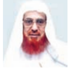
كتبه لكم: أبو عبدالرحمن ابن عقيل الظاهري *