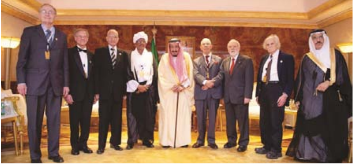
خادم الحرمين الشريفين يحيط به الفائزون وأمين الجائزة