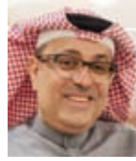
عبد الكريم الممتن: وزارة الإسكان أسهمت في استقرار السوق وتحصيح كثير من السليبات