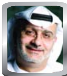
مسعود أمر الله