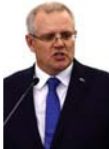
رئيس الوزراء الأسترالي سكوت موريسون

فجر الرئيس التركي رجب طيب أردوغان أزمة مع كل من أستراليا ونيوزيلندا بعد ربطه منفذ الهجوم على مسجدين في نيوزيلندا بمعركة انتصرت فيها تركيا على أستراليا ونيوزيلندا قبل نحو قرن من الزمن. رئيس الوزراء الأسترالي، سكوت موريسون، استدعى المبعوث التركي ببلاده، معتبراً أن تصريحات أردوغان «مهينة للأستراليين ومتهورة خصوصاً في الظروف الحساسة الحالية»، لافتاً إلى أن جميع خيارات الرد