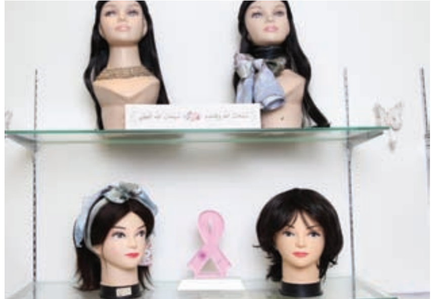
سيدات يتبرعن بشعرهن لصناعة الشعر المستعار