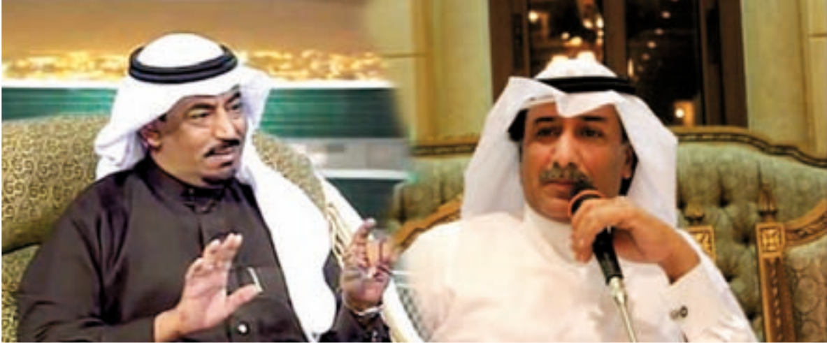
الشاعر علي الأمير