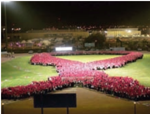
أطول شريط بشري في جامعة الأميرة نورة للتوعية بأهمية الفحص المبكر

تأسيس الجمعية: في عام ٢٠٠٧ بدأت الجمعية نشاطها بشكل رسمي بعد لقاء الدكتورة سعاد العامر بالأميرة هيفاء الفيصل،