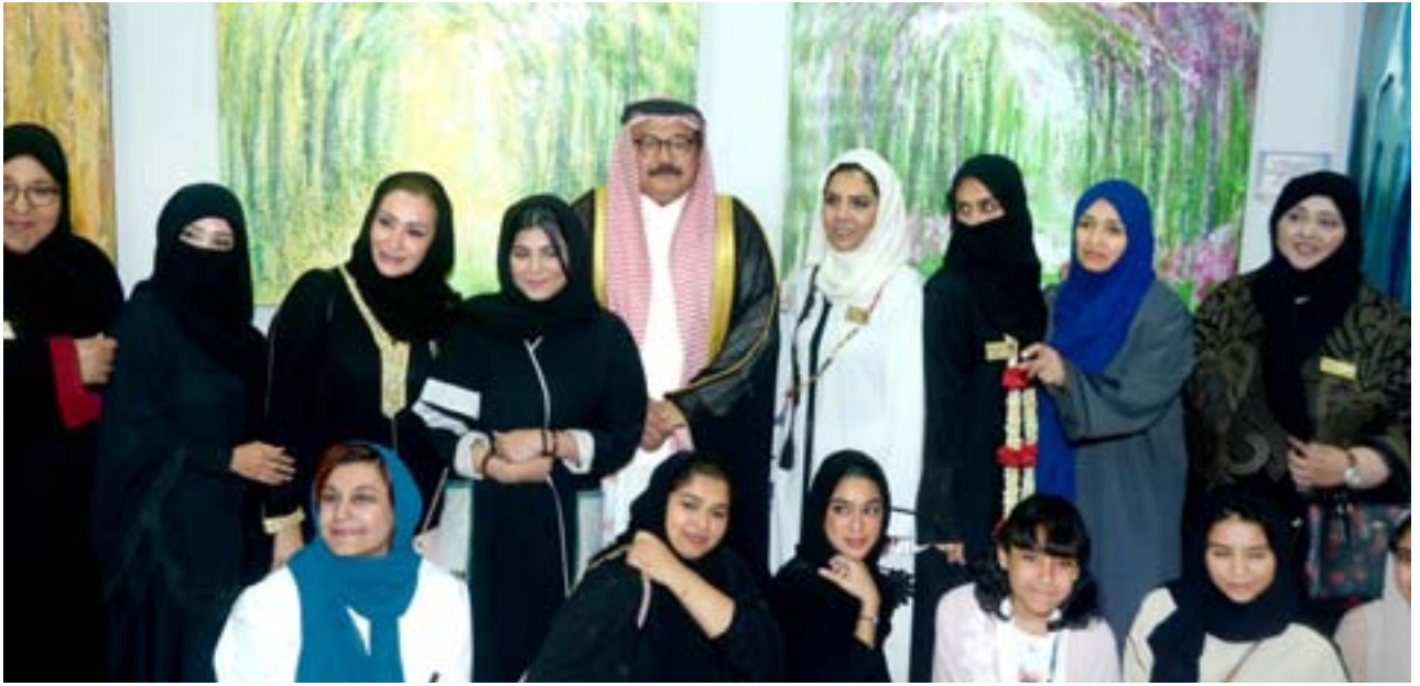
لقطة جماعية تجمع الدحلان مع فنانات رحلة فن.

أن شاركت بلوحة عن جبل عرفات في مجلس الفن السعودي. وجودي اليوم، أتاح لي التعرف على الفنانات السبع المشاركات، وما يمكن قوله عنهن، أن لكل واحدة منهن لمسة خاصة، وأعمالهن جميعاً على درجة كبيرة من التميز والاحترافية.